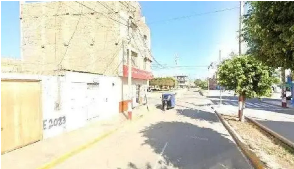
Botica dchanga zona