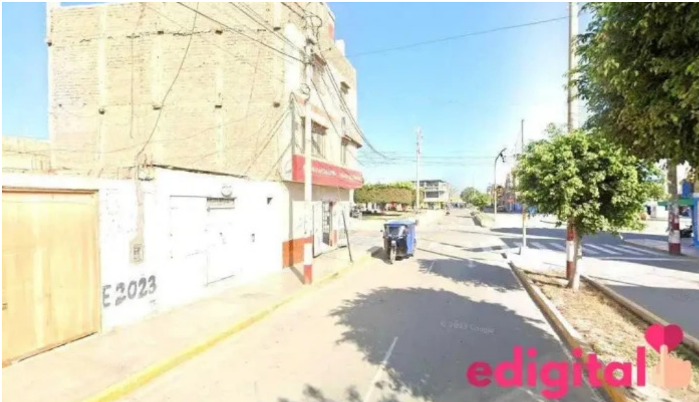
Botica d changa huarney