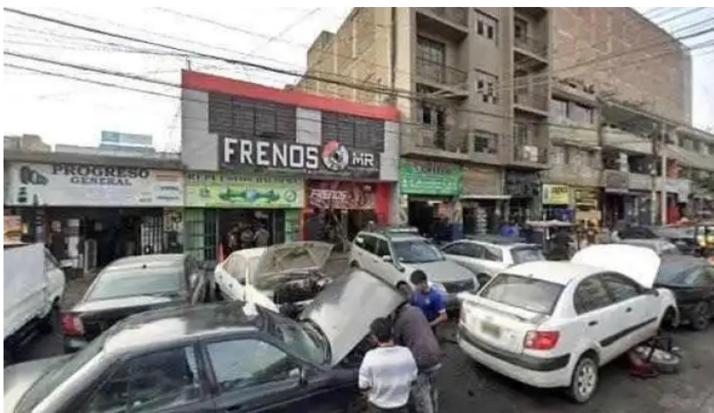
Inkafarma como llegar