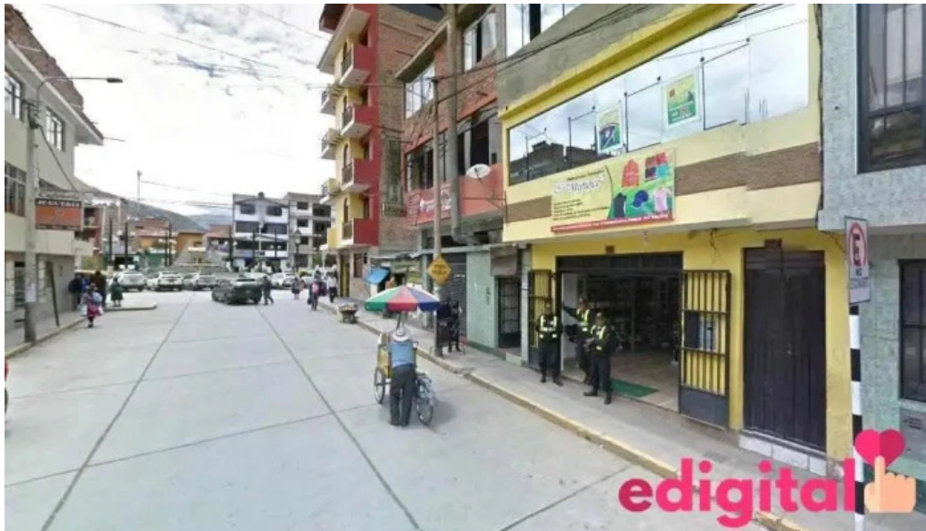
Boticas salud y hogar huaraz