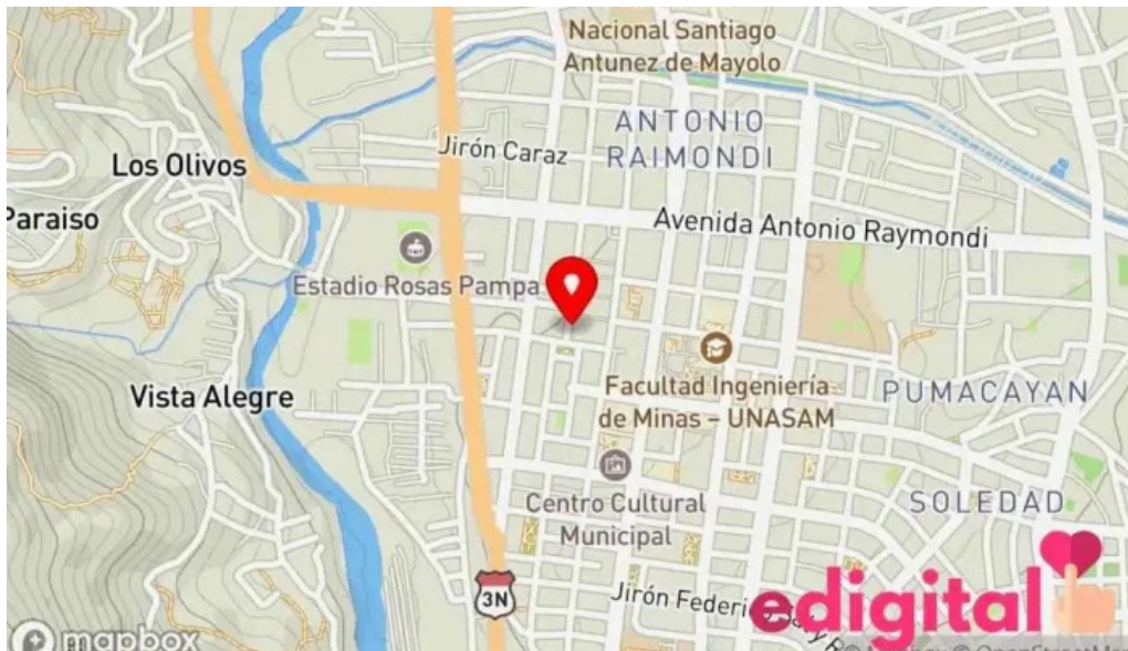
Boticas salud y hogar mapa