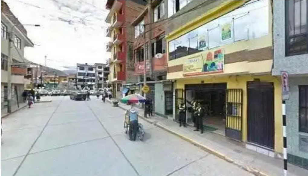
Boticas salud y hogar puntaje