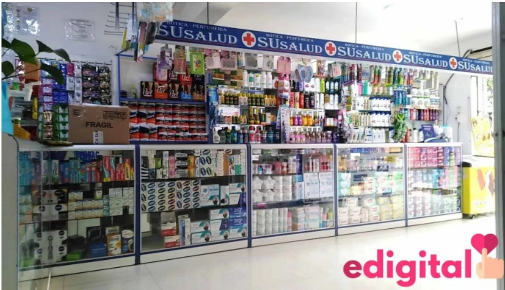
Botica su salud numero