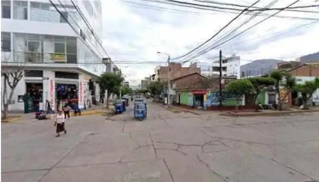
Botica su salud numerodeg