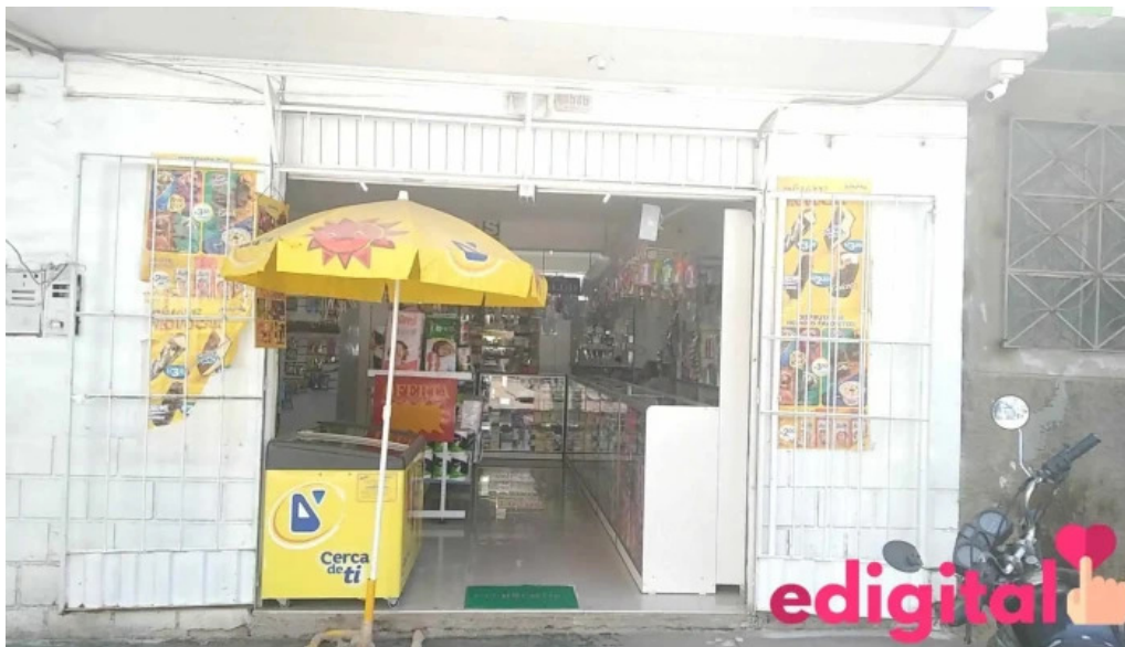
Botica su salud huanta