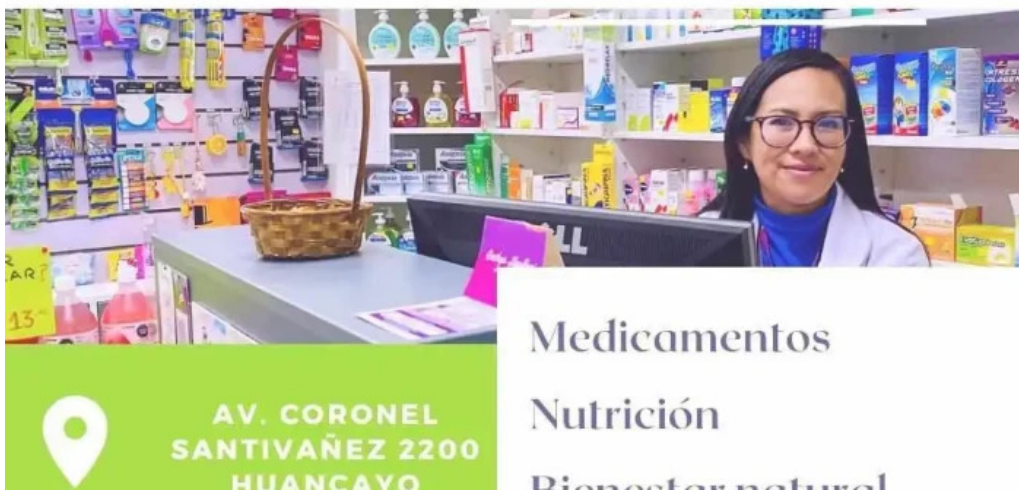
Farmacia harmony huancayo