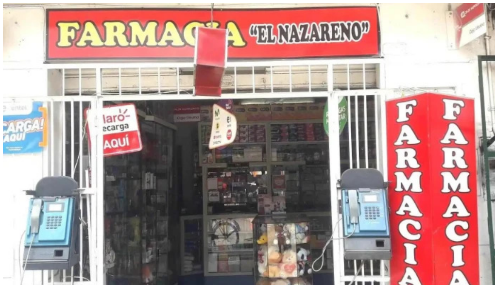
Farmacia el nazareno direccion