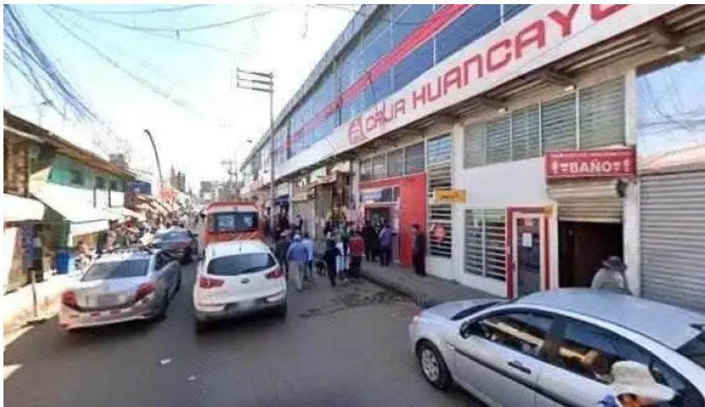
Farmacia el nazareno direcciondeg