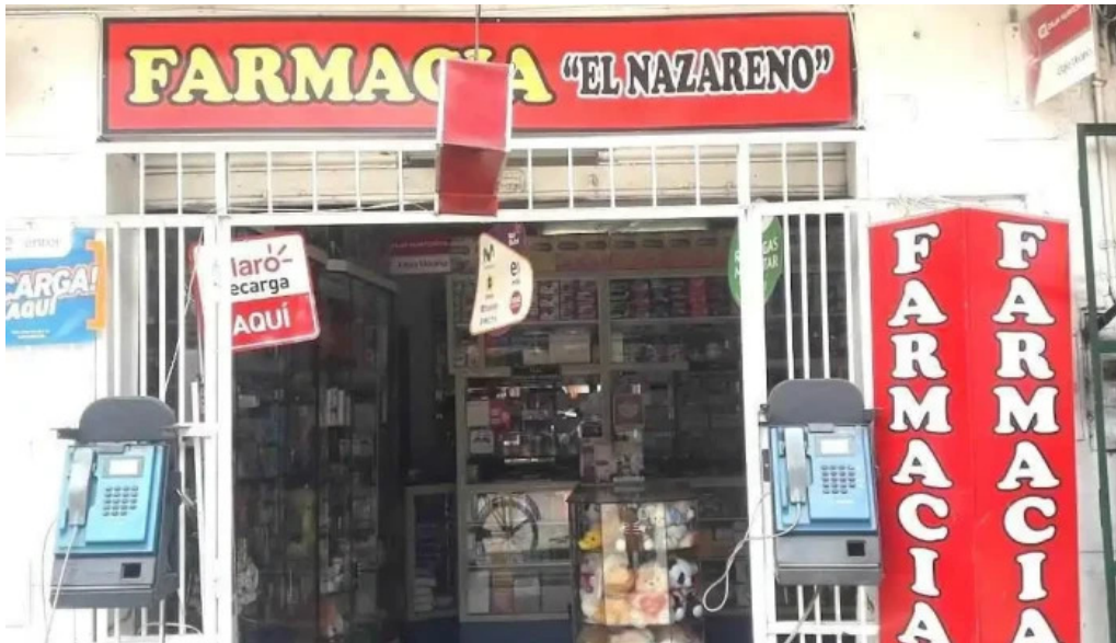
Farmacia el nazareno huancayo