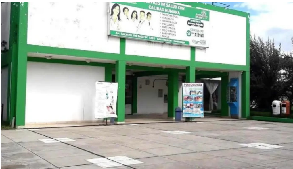
Centro medico municipal huancayo