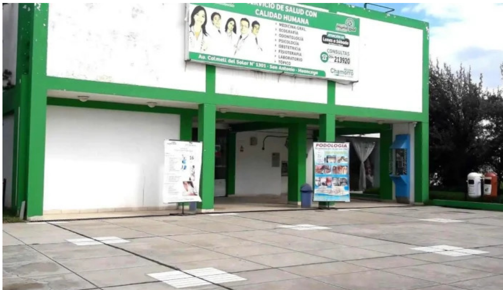
Centro medico municipal comentarios