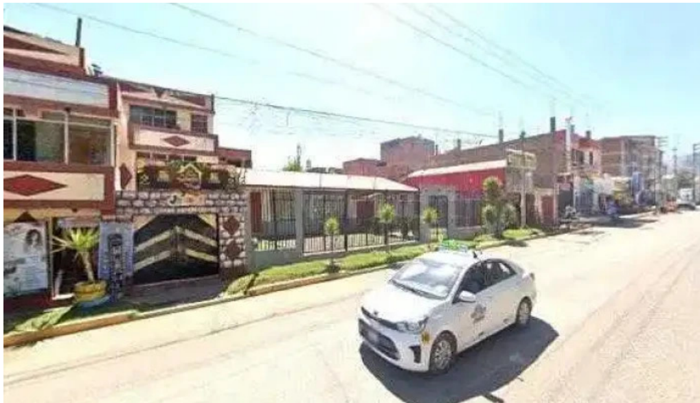
Centro medico municipal comentariosdeg