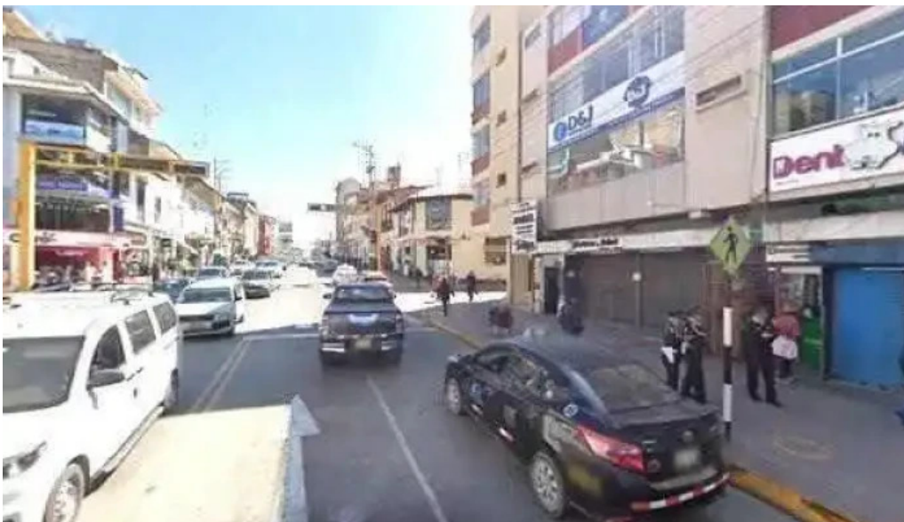
Boticas y salud numerodeg