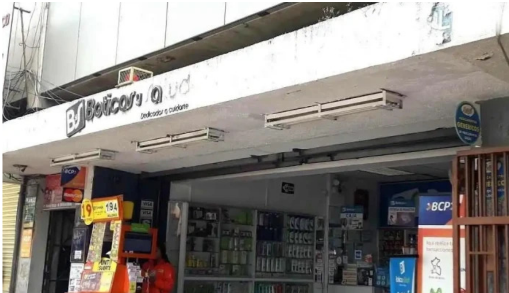
Boticas y salud huancayo