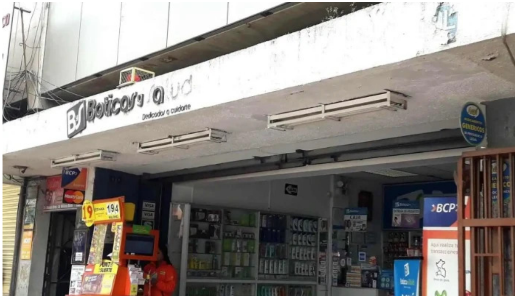
Boticas y salud numero