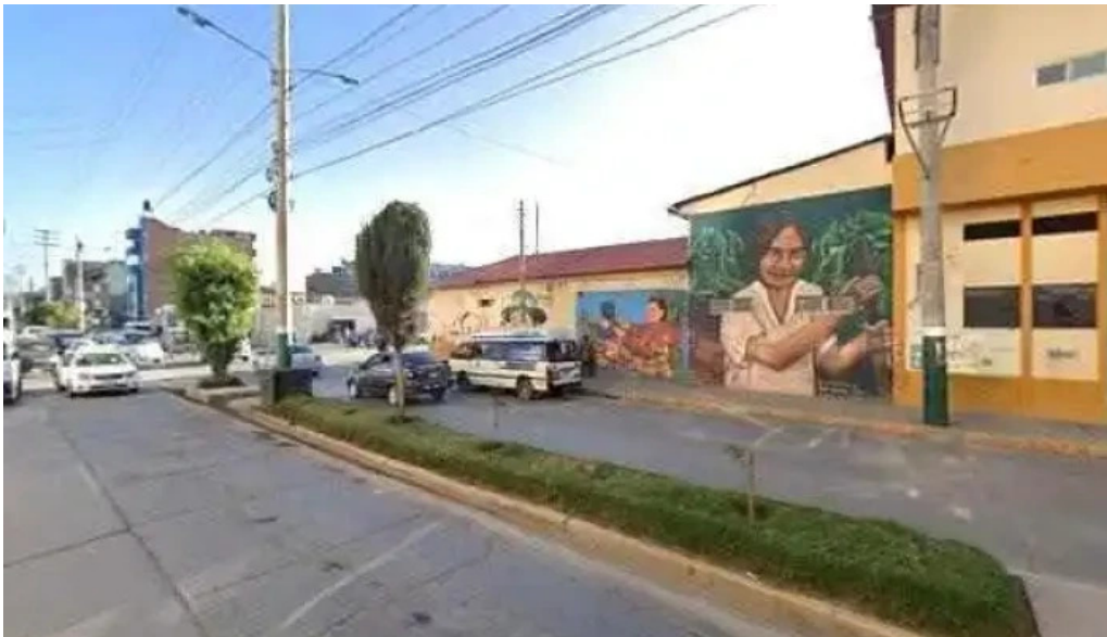
Boticas huancayo como llegardeg