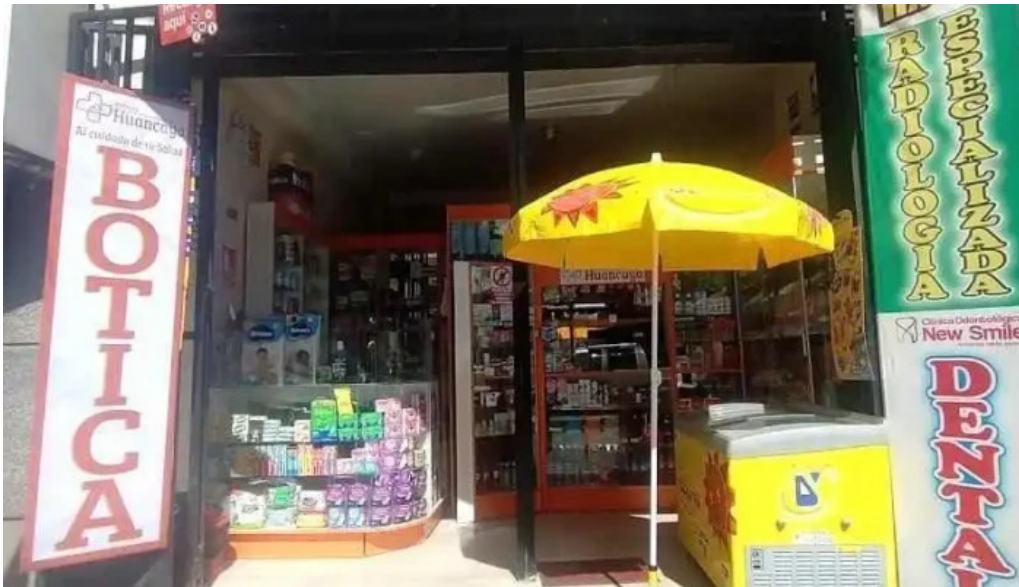
Boticas huancayo huancayo