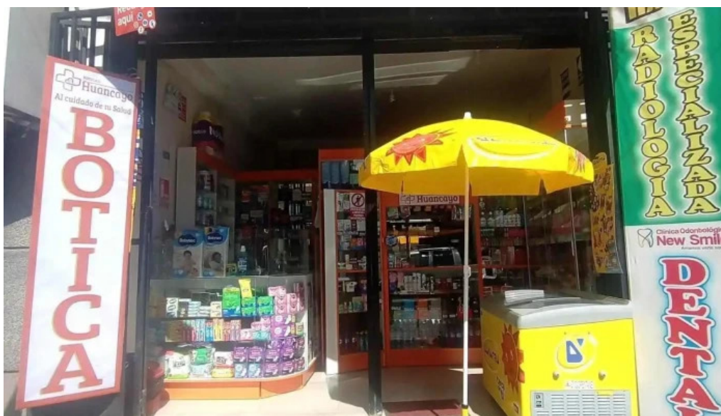
Boticas huancayo como llegar