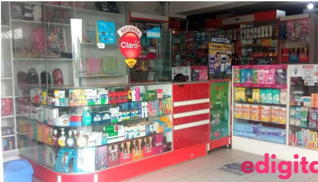
Boticas farmafe telefono