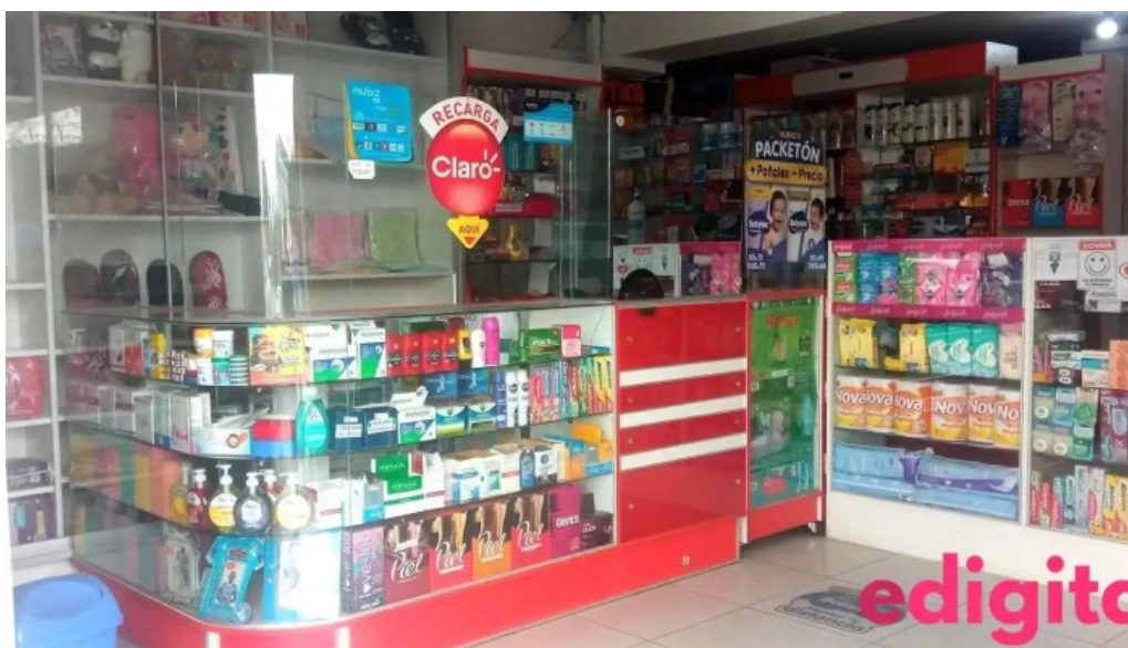
Boticas farmafe huancayo