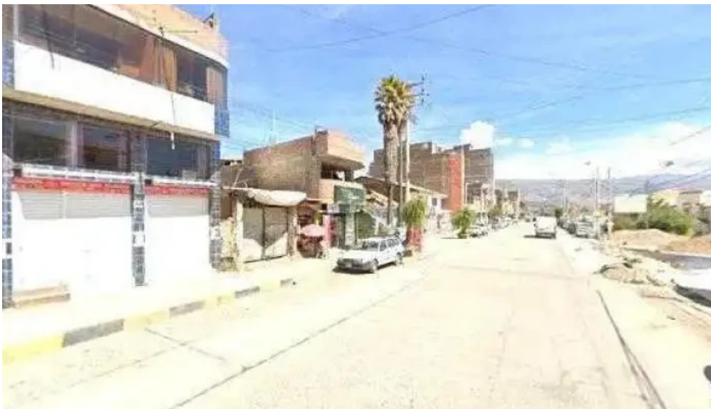
Boticas farmafe telefonodeg