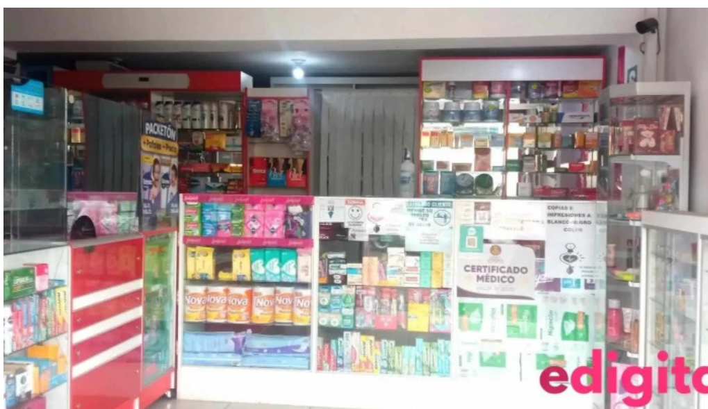
Boticas farmafe del propietario