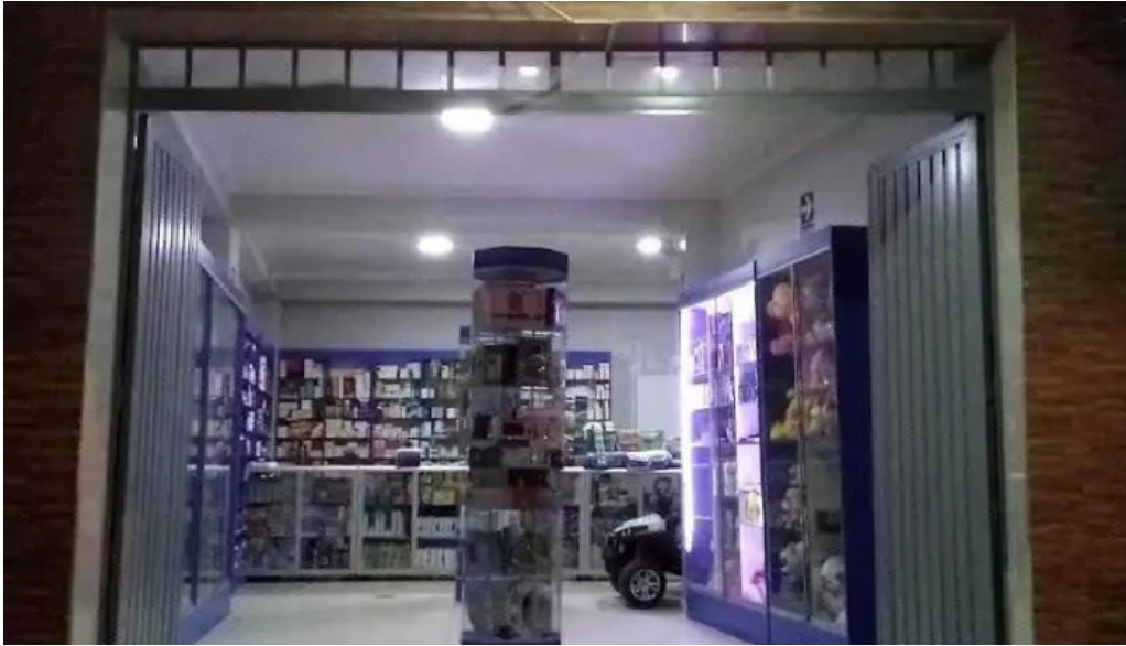
Botica san miguelito distrito de san luis