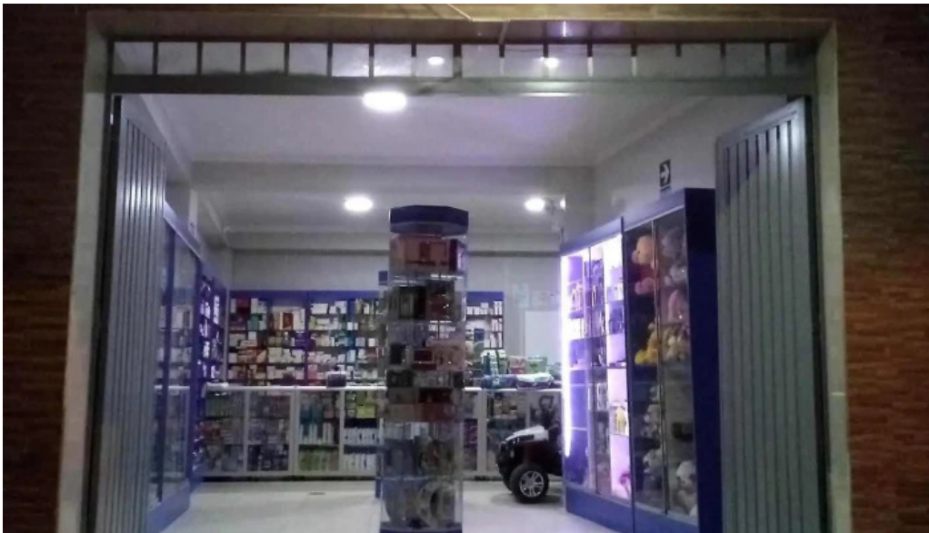
Botica san miguelito direccion