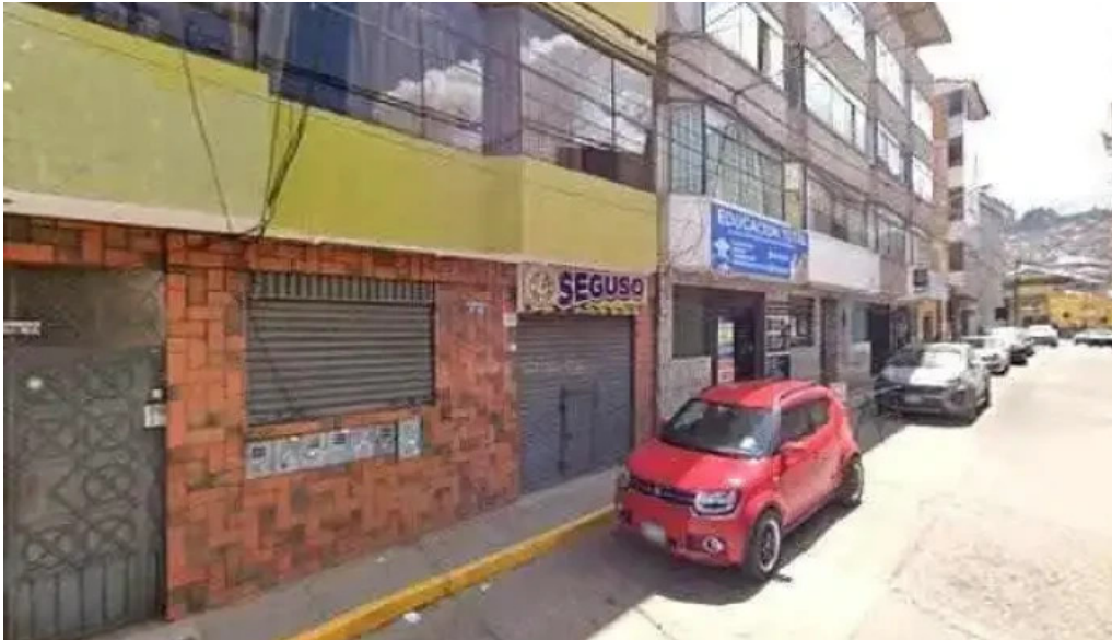
Salud y vida ubicacion