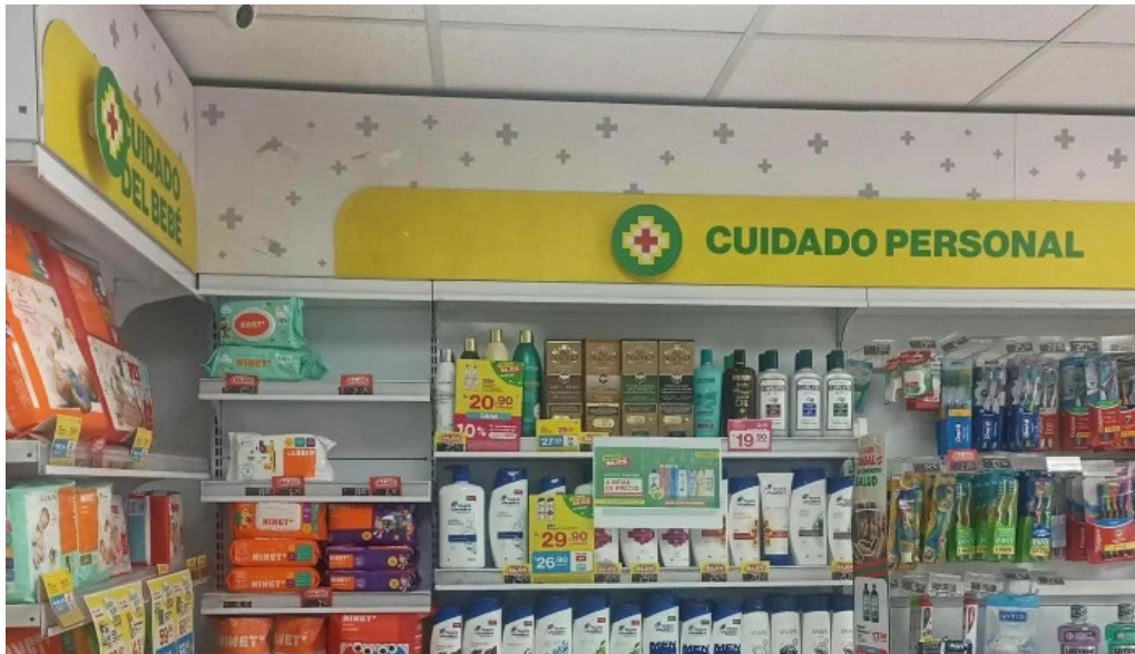
Inkafarma como llegar