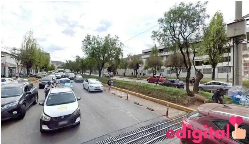
Fasa 439 cusco