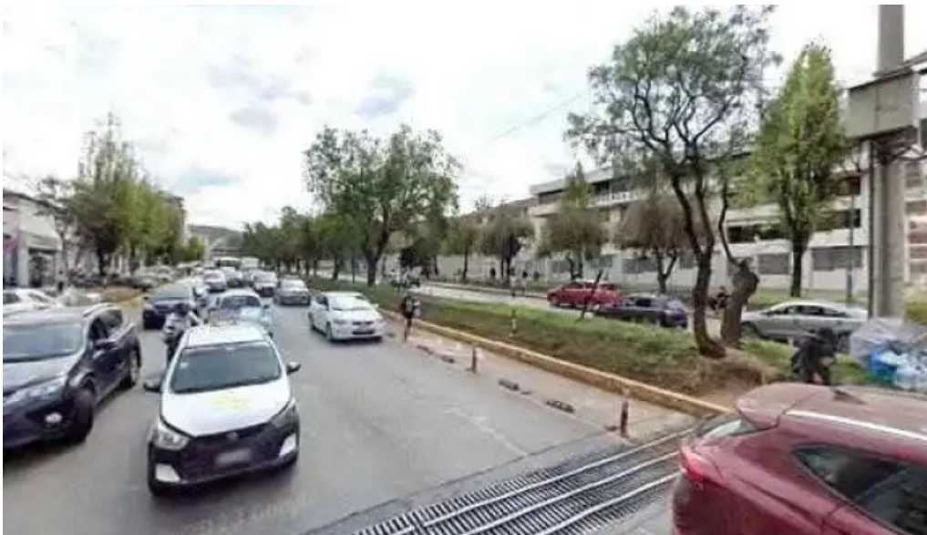
Fasa 439 zona