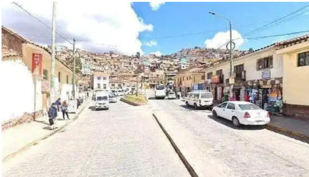
Farmacia nino jesus abierto ahora