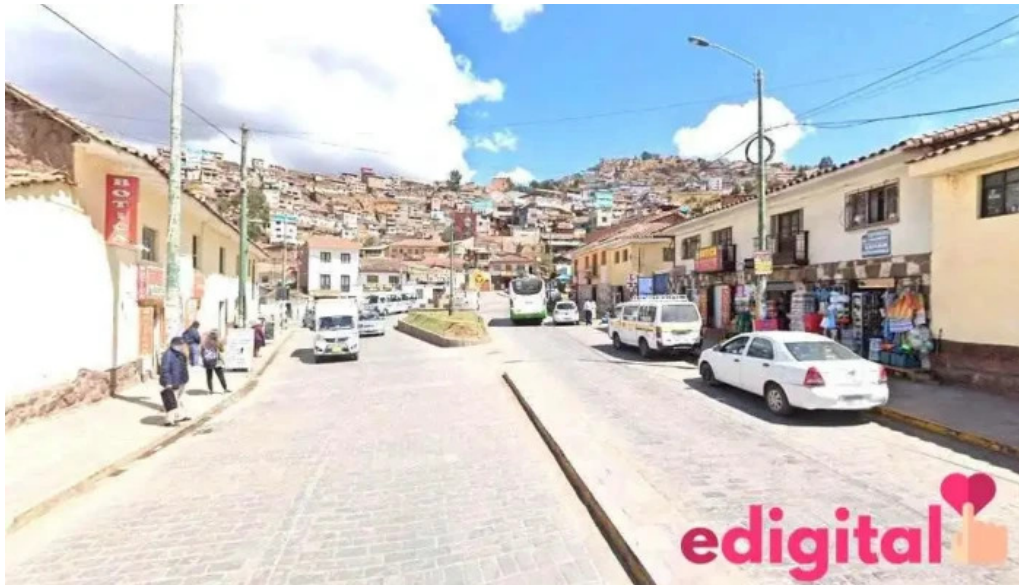
Farmacia nino jesus cusco