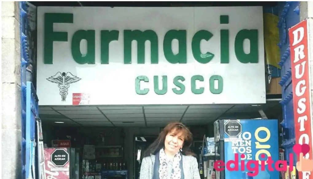
Farmacia cusco drugstore cusco