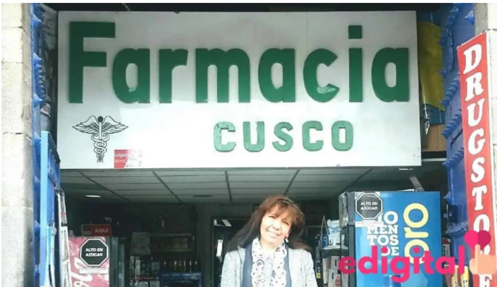
Farmacia cusco drugstore descuentos