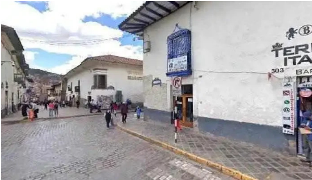
Farmacia cusco drugstore descuentosdeg