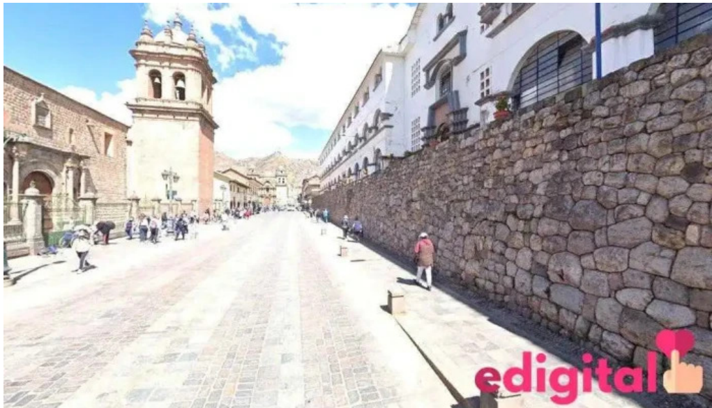
Drugstore el rey david cusco