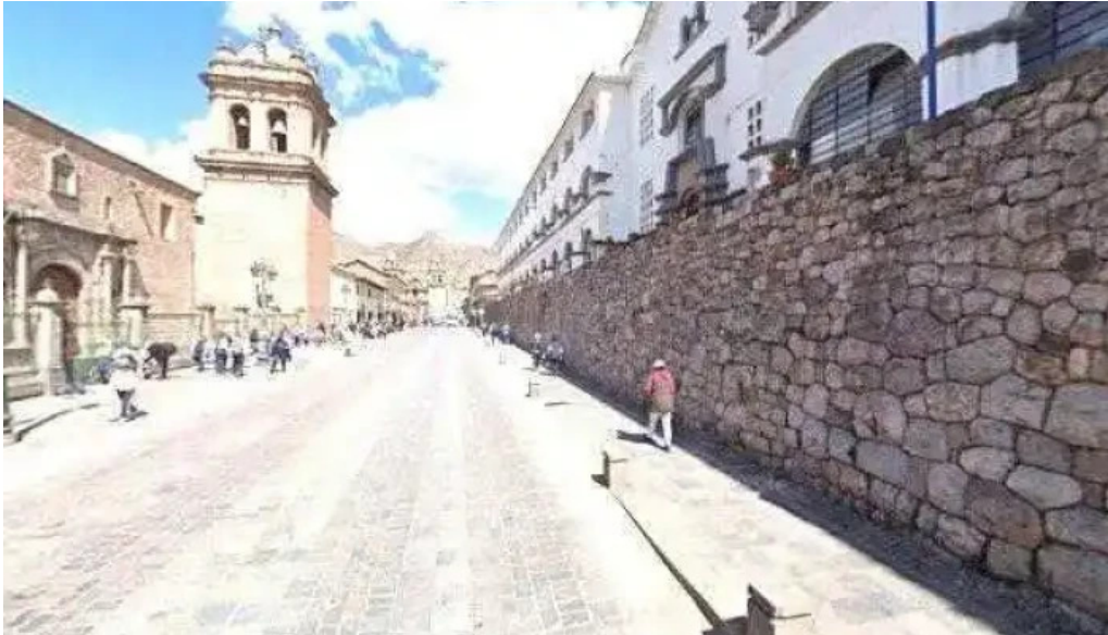
Drugstore el rey david cerca de mi