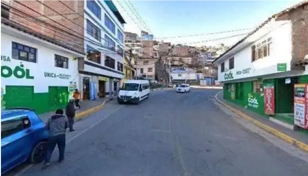
Botica pharmacy agente interbank y caja arequipa direcciondeg