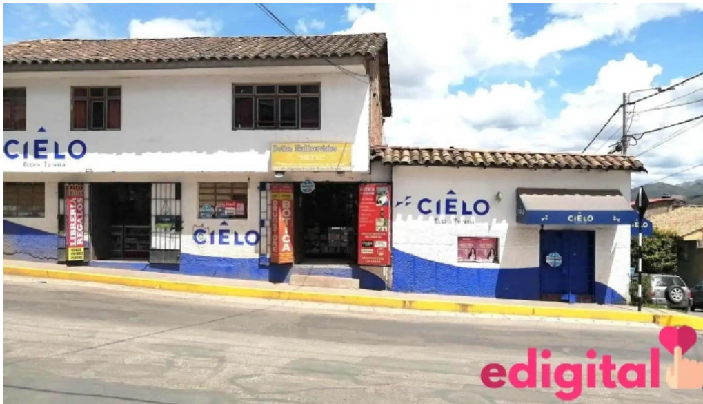
Botica pharmacy agente interbank y caja arequipa cusco