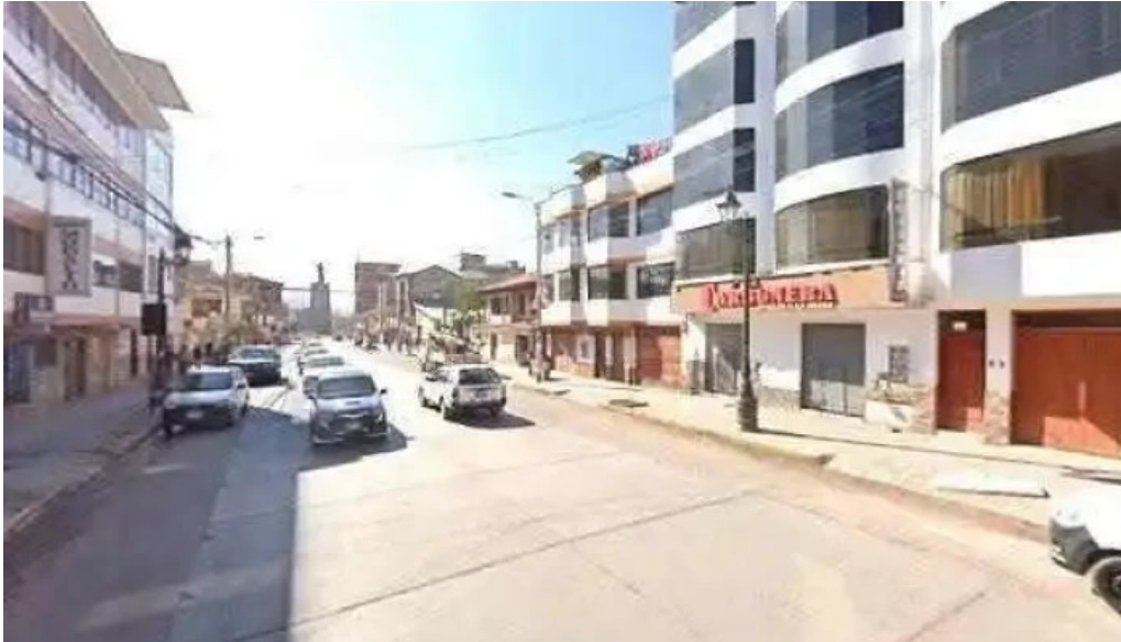
Botica multiservicio farma americana comentarios