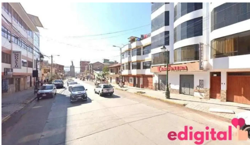
Botica multiservicio farma americana cusco