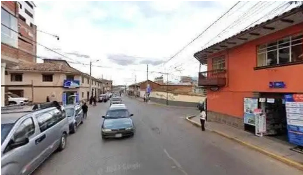
Agente bcp farmacia la paz tahuantinsuyo sitio webdeg