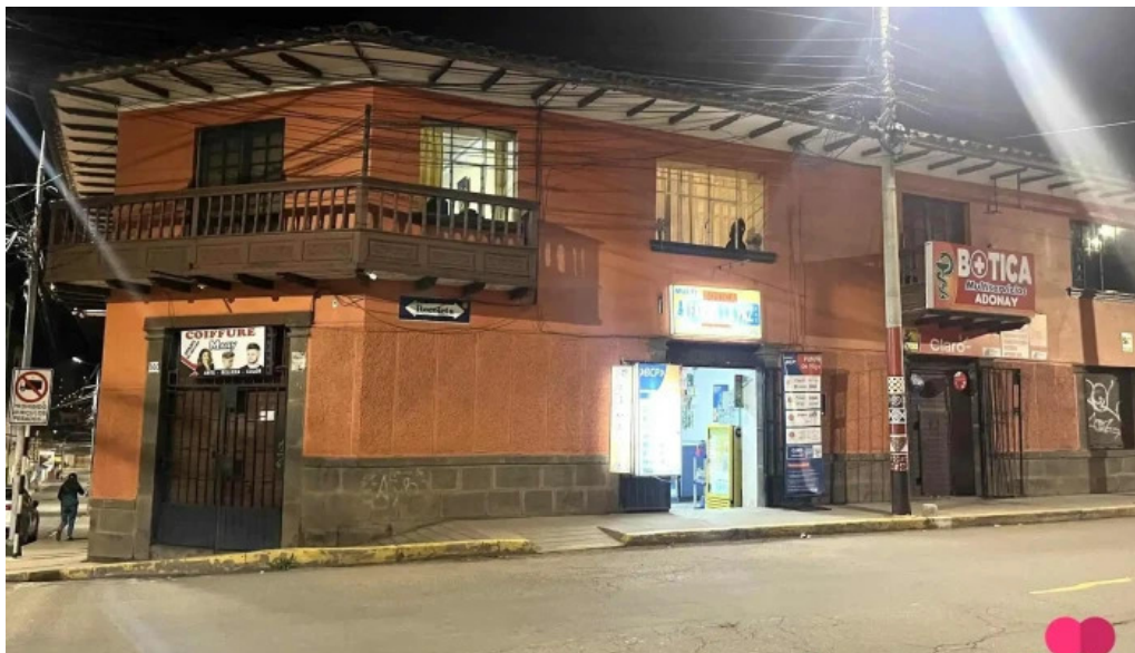
Agente bcp farmacia la paz tahuantinsuyo del propietario