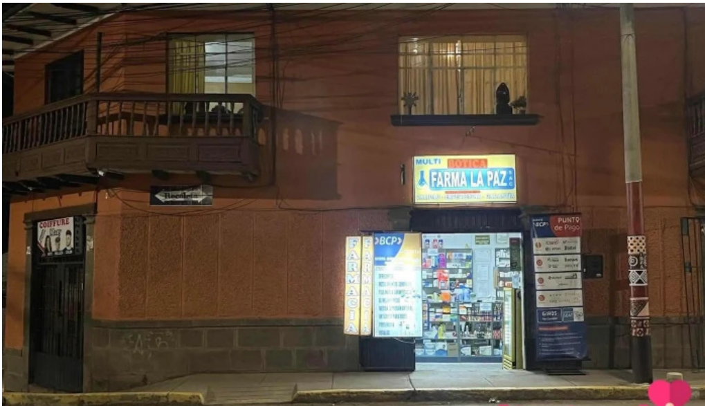
Agente bcp farmacia la paz tahuantinsuyo sitio web