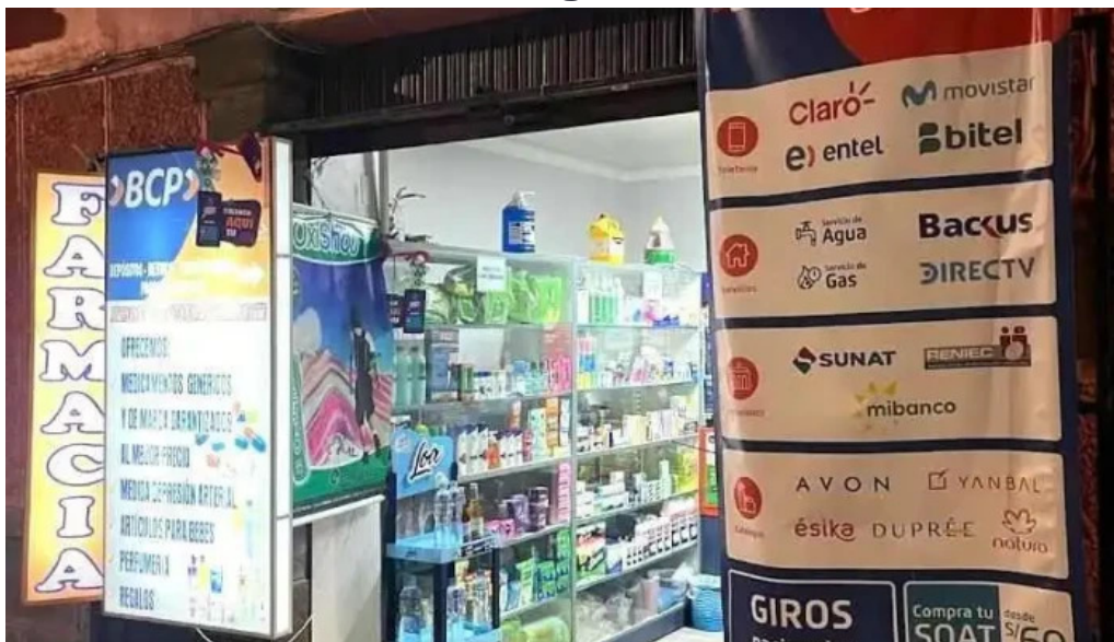
Agente bcp farmacia la paz tahuantinsuyo cusco