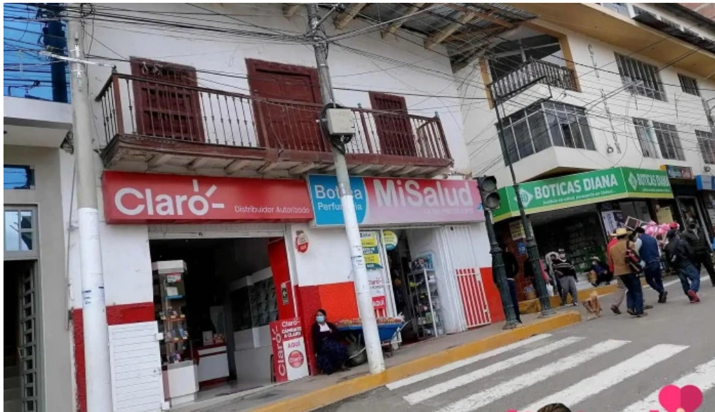
Botica mi salud fotos