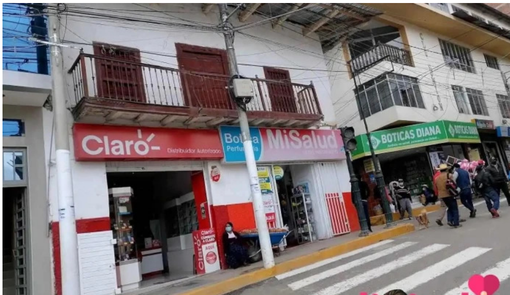
Botica mi salud chota