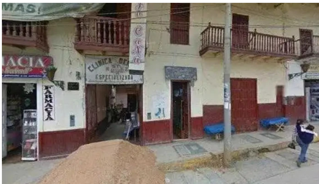
Botica mi salud fotosdeg