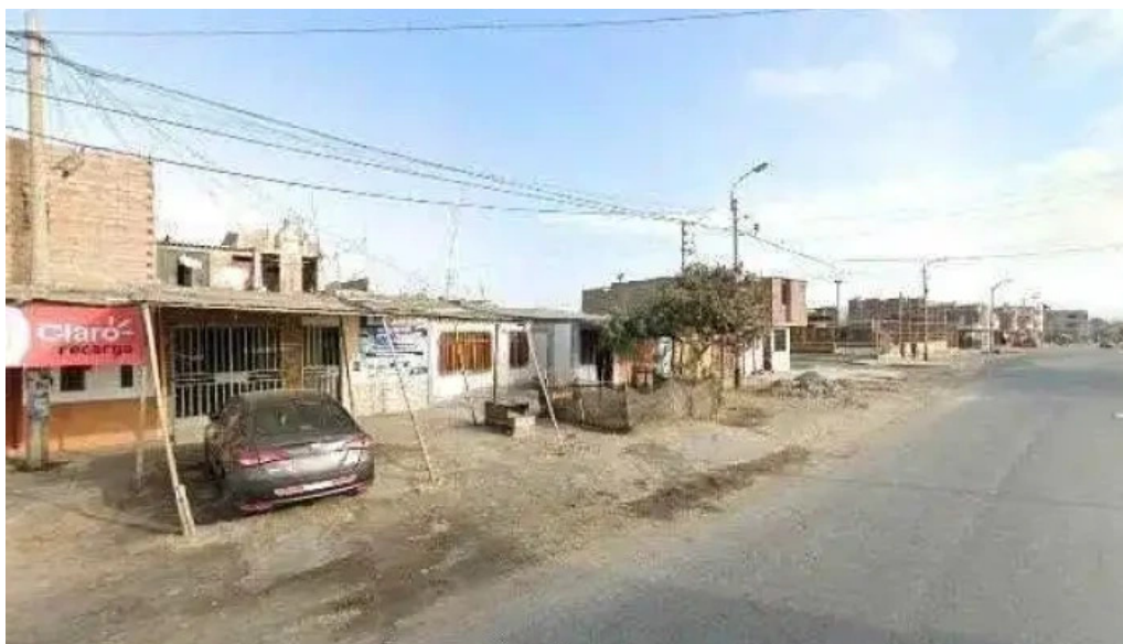
Vidafarma como llegar