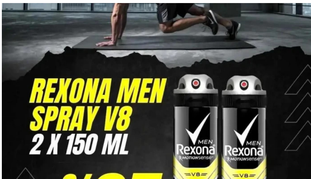
Libertfarma del propietario