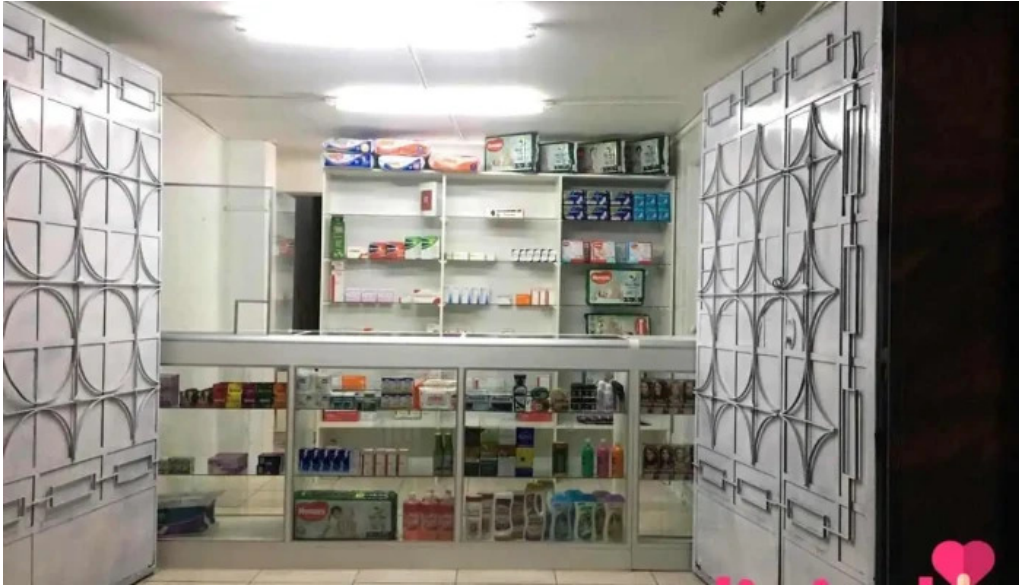
Jj farma zona