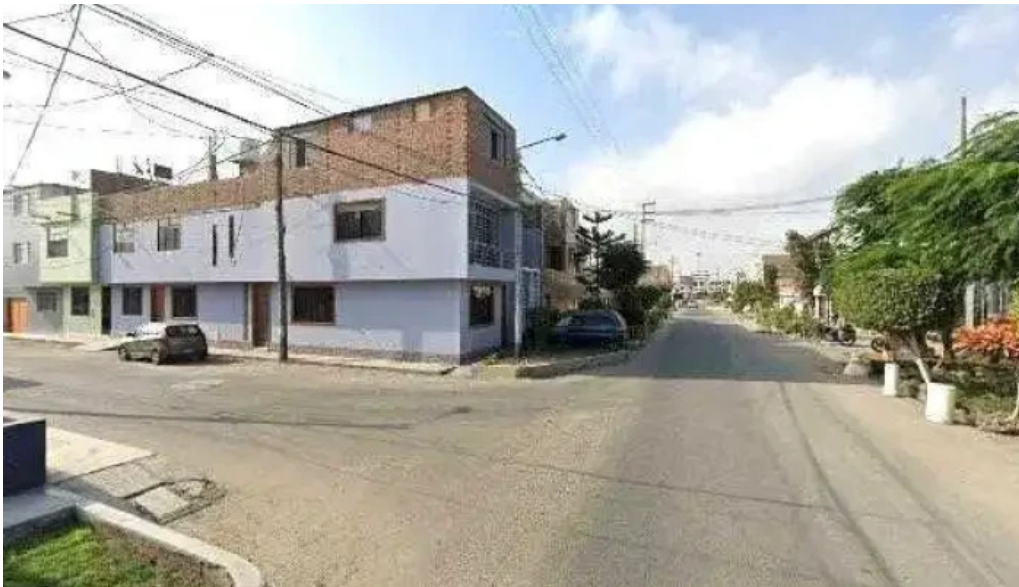
Jj farma zonadeg