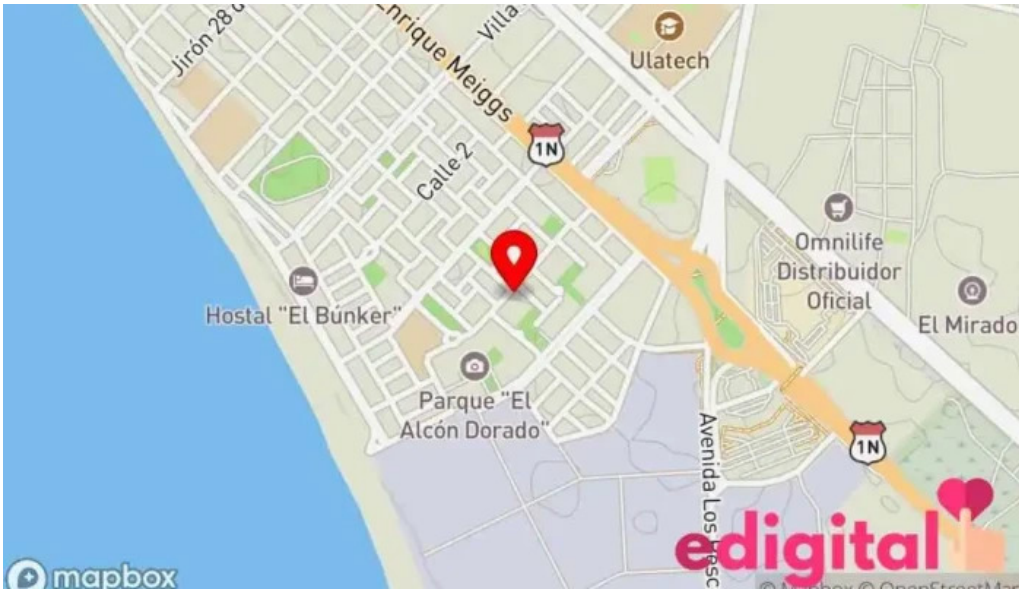
Jj farma mapa