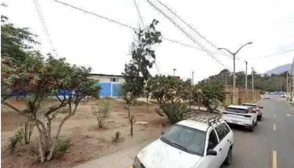
Inkafarma cerca de mi