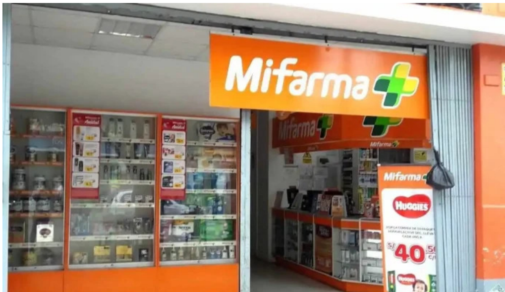
Mi farma videos