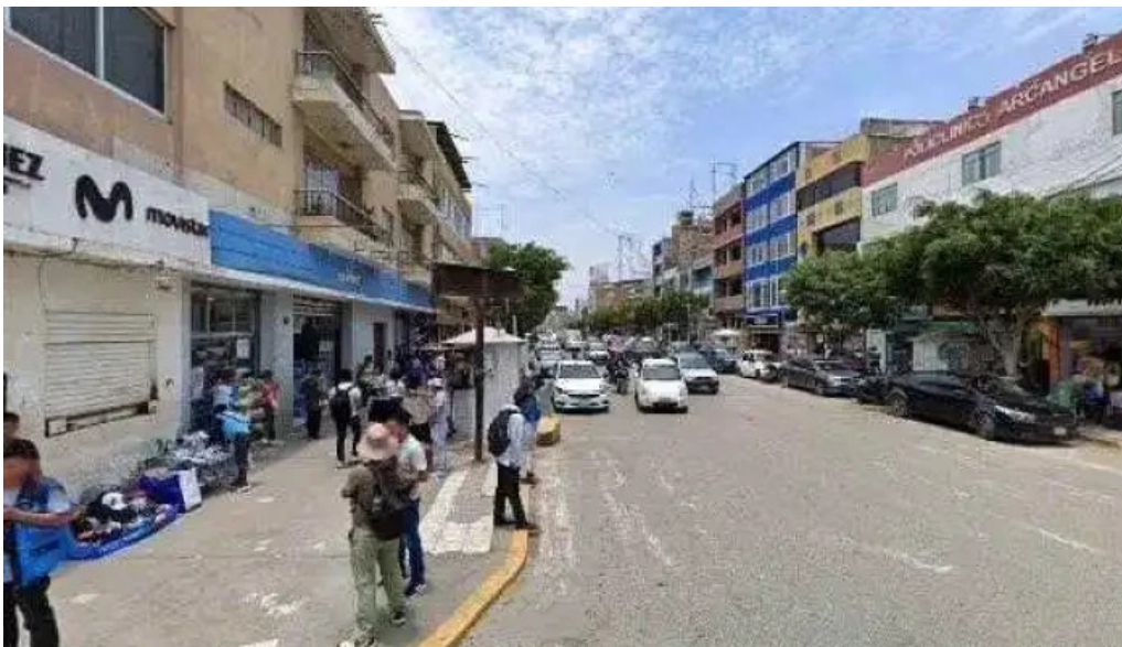
Mi farma videosdeg