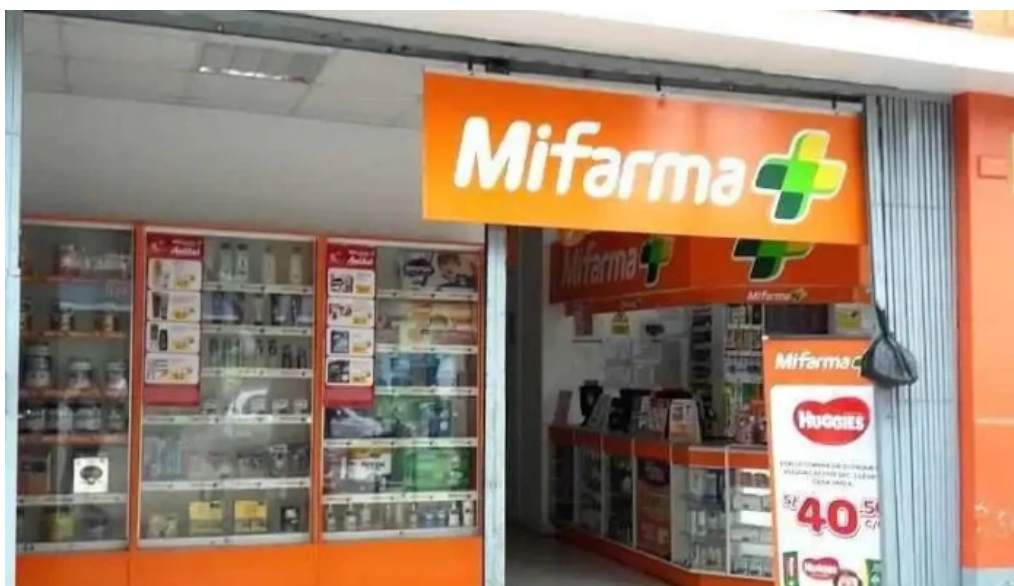
Mi farma chiclayo