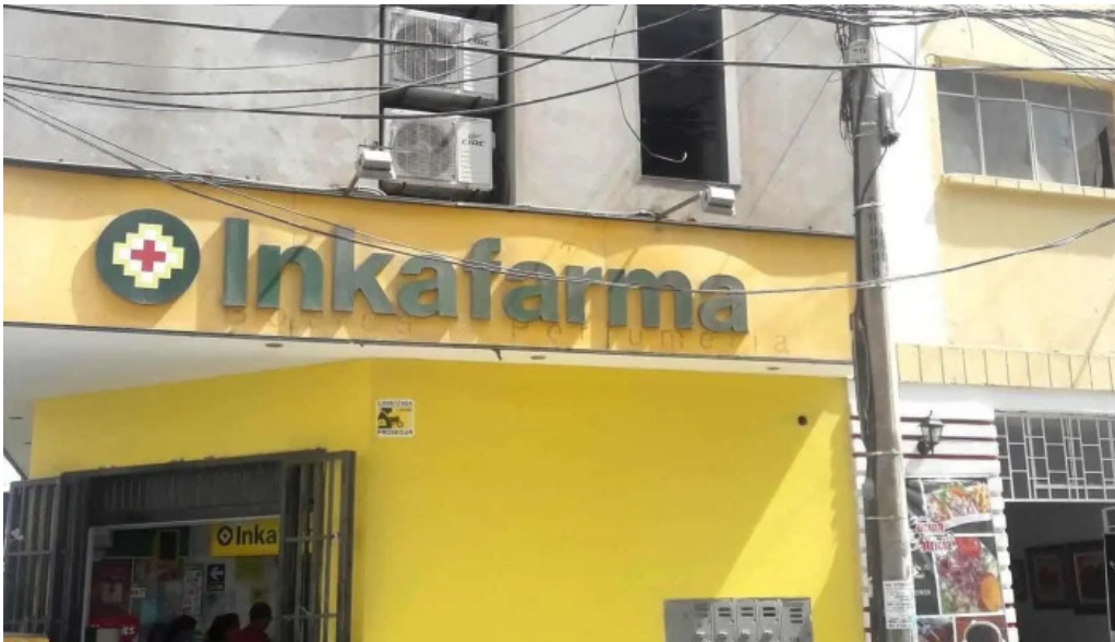
Inkafarma como llegar