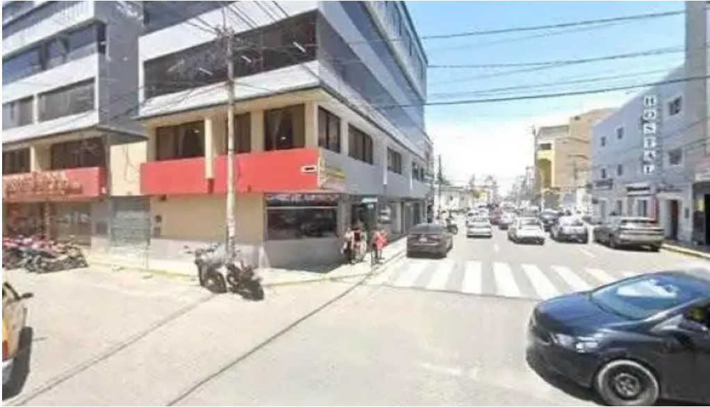
Inkafarma como llegardeg