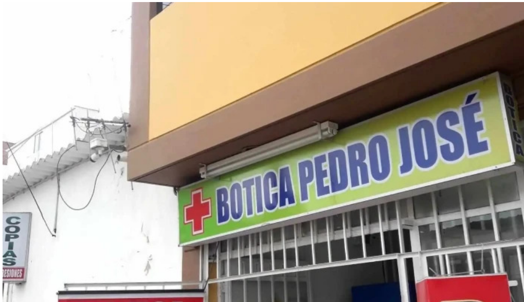
Botica pedro jose telefono