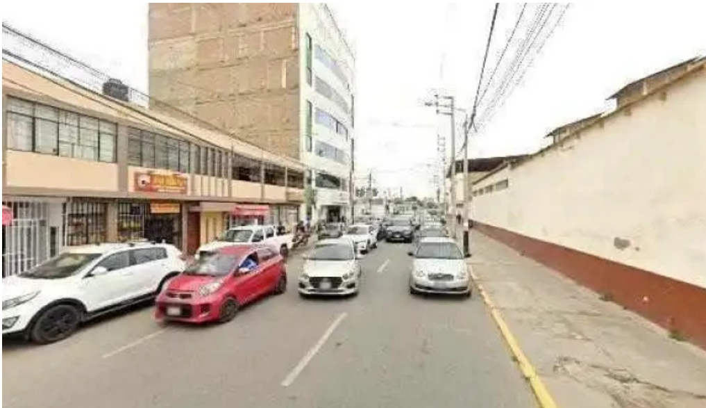
Botica Pedro José Telefonodeg