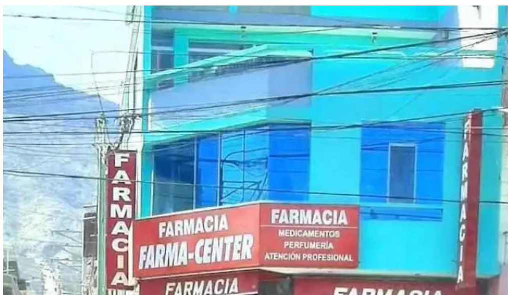
Farma center chepen