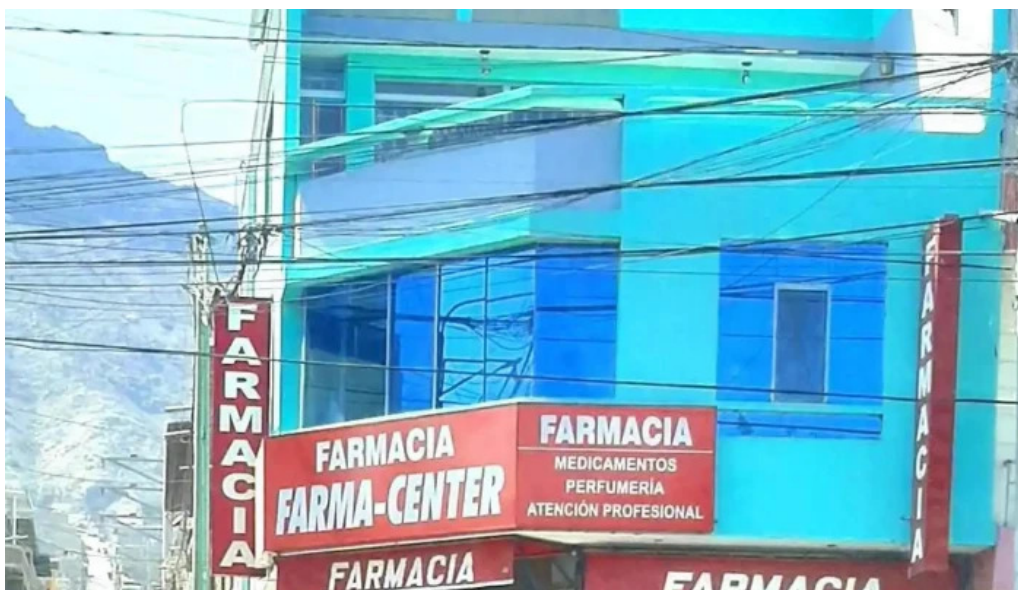
Farma center puntaje