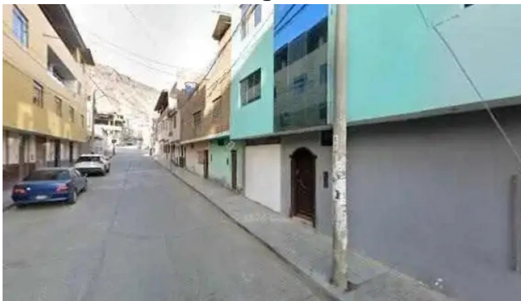
Farma center puntajedeg