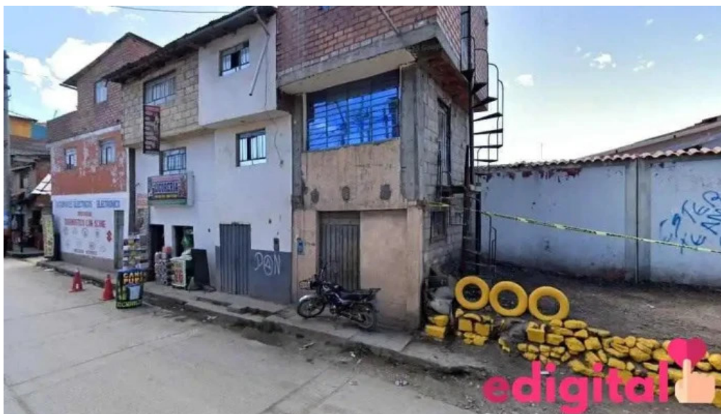
Inkafarma cerro de pasco