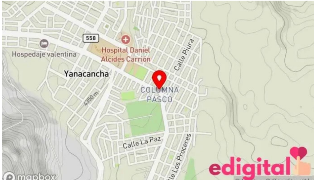
Botica s mapa