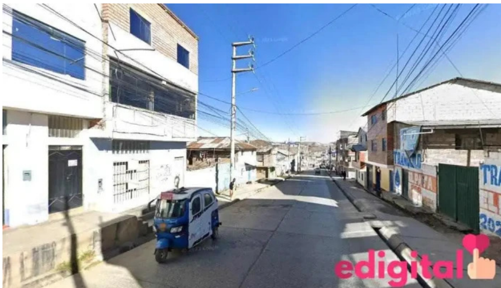
Botica s cerro de pasco