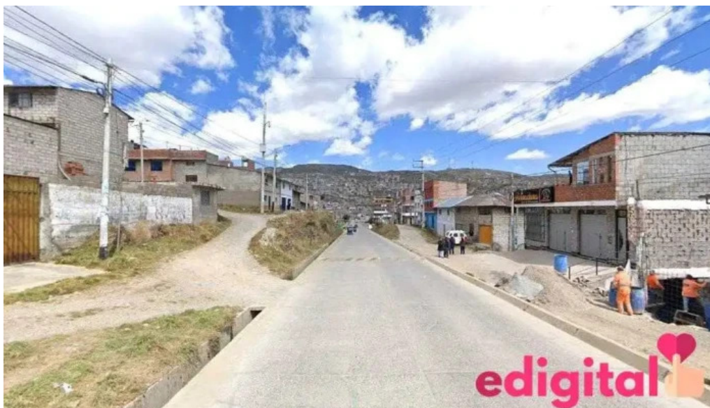
Botica dental cerro de pasco