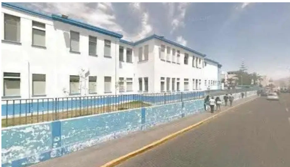
Farmacia ca val descuentos