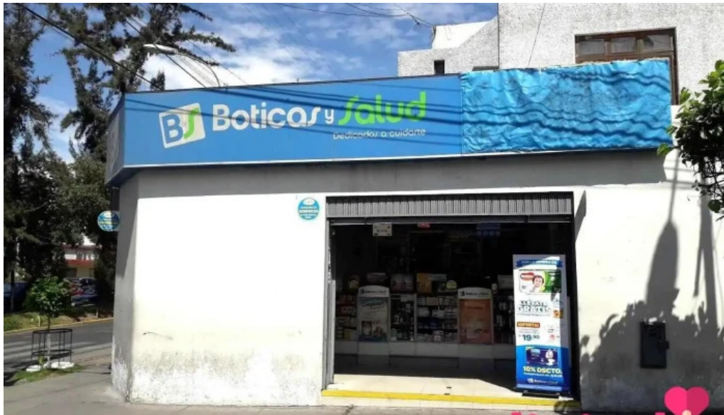
Boticas y salud cercado de arequipa