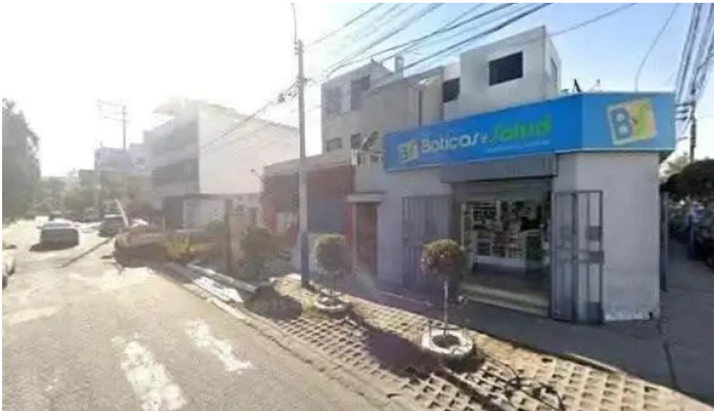
Boticas y salud como llegardeg