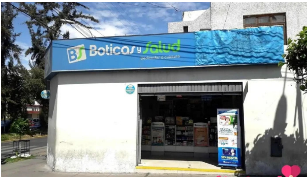
Boticas y salud como llegar