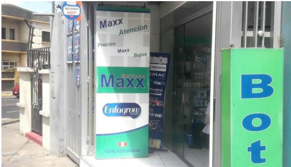
Boticas maxx telefono