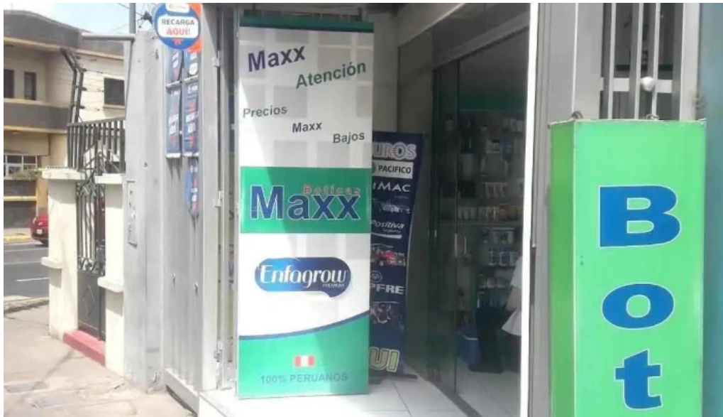
Boticas maxx cercado de arequipa