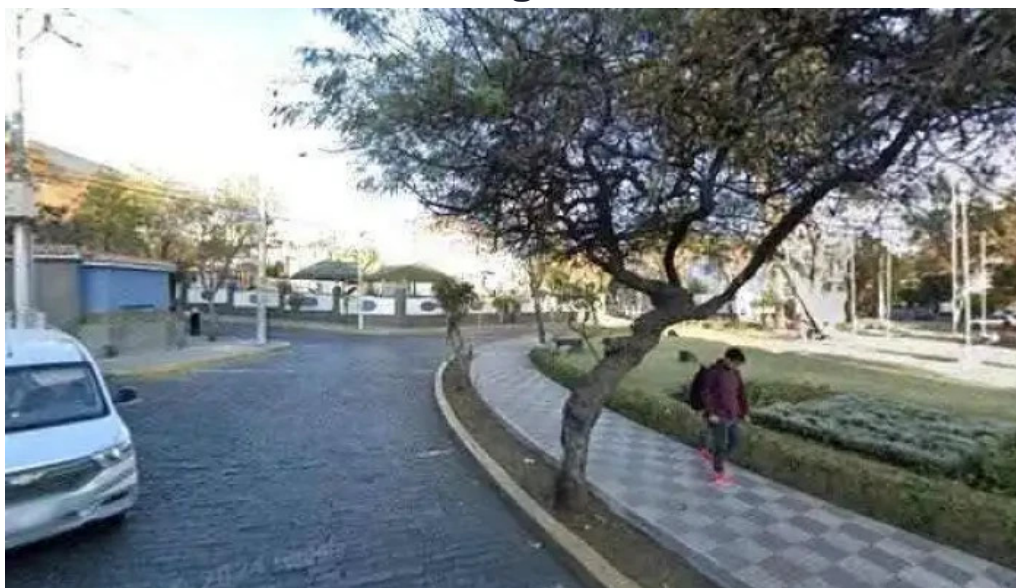
Boticas maxx telefonodeg