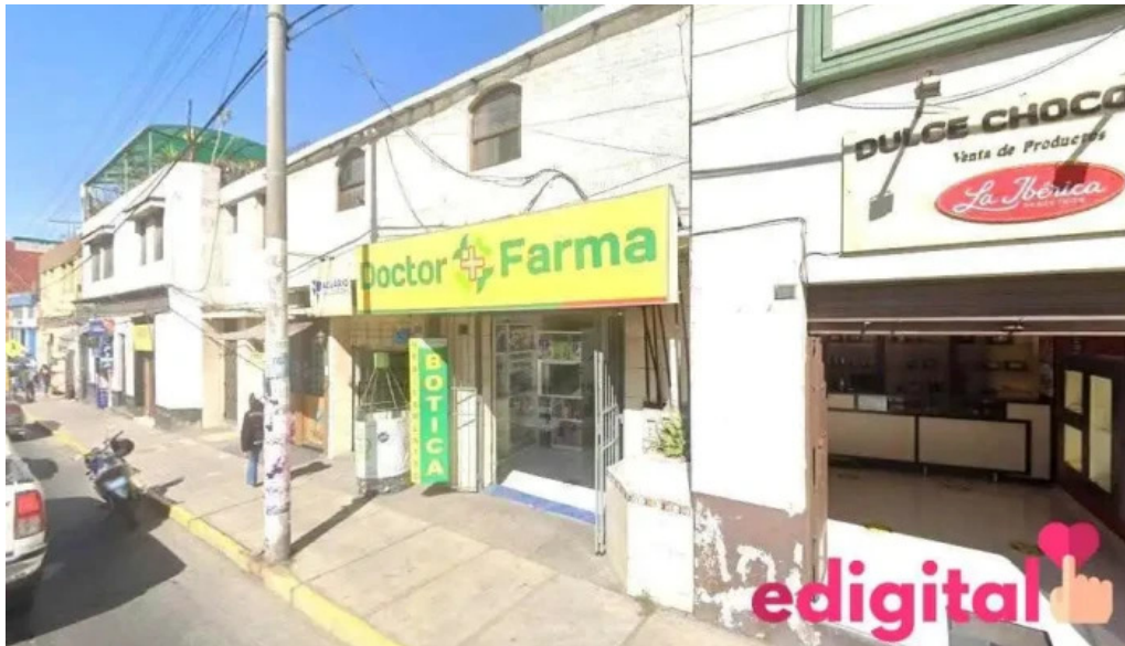
Botica s aq mercado de arequipa