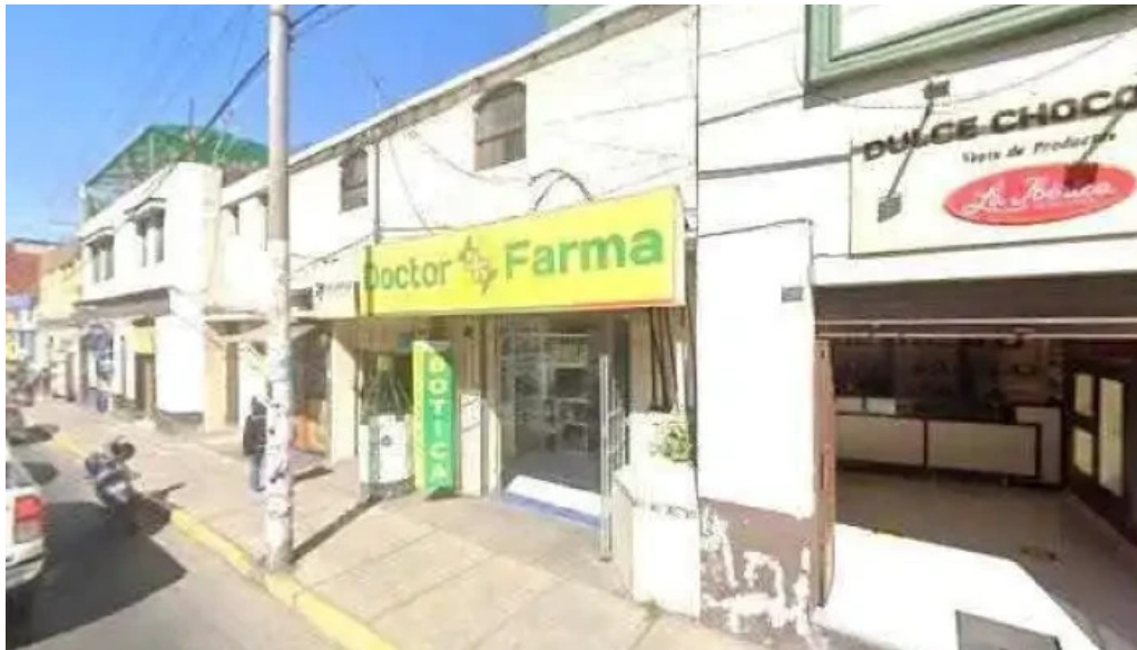
Boticas aq instagram