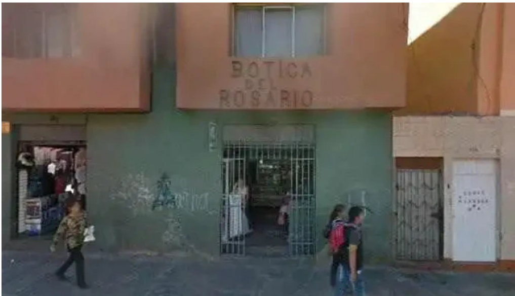
Botica del rosario puntaje