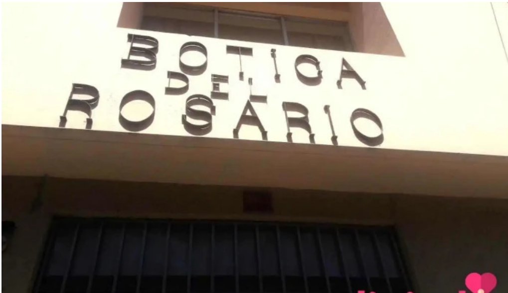
Botica del rosario cercado de arequipa