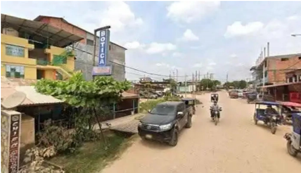
Botica pueblo salud telefono