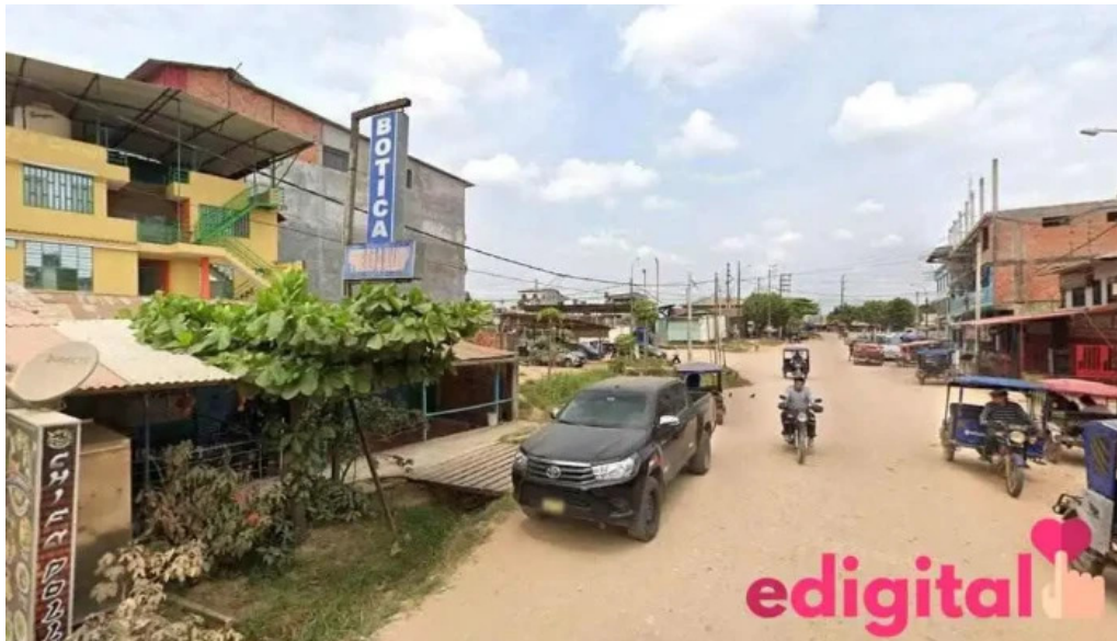
Botica pueblo salud campoverde