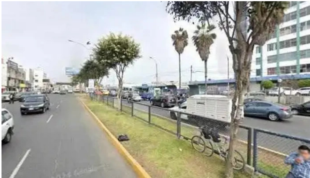
Inkafarma guardia chalaca abierto ahoradeg