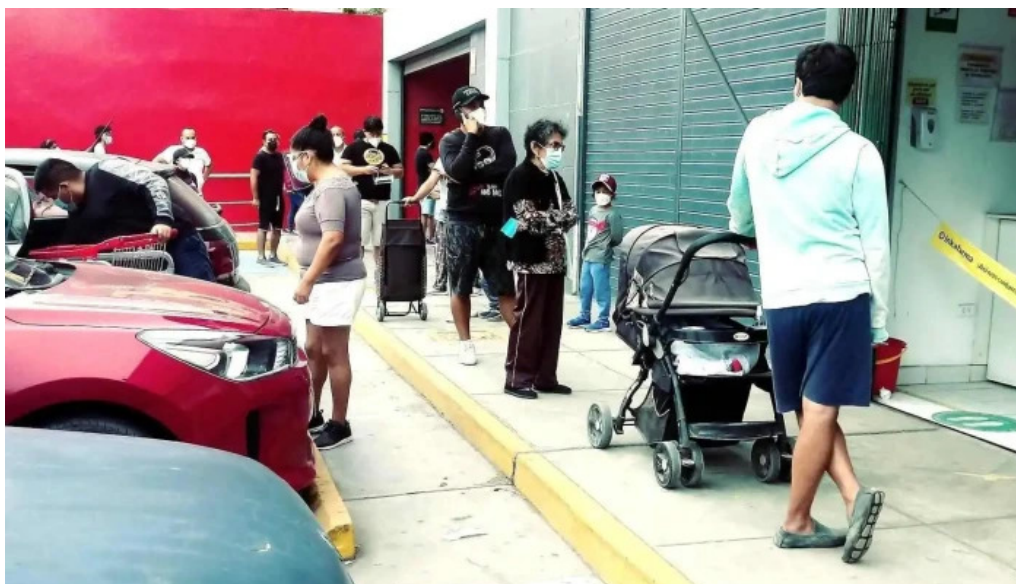
Inkafarma guardia chalaca abierto ahora