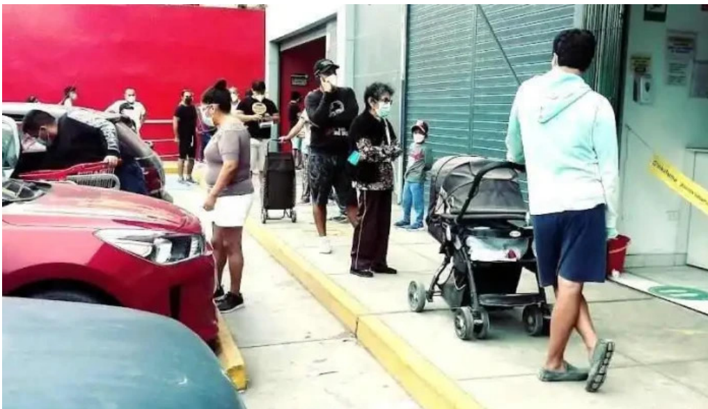
Inkafarma guardia chalaca callao