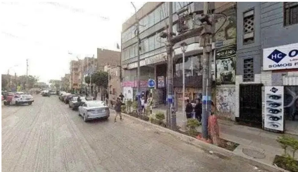
Boticas y salud callao 1 abierto ahoradeg