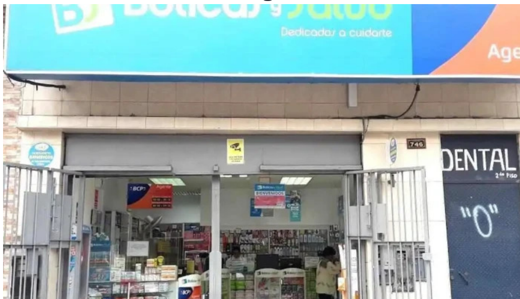
Boticas y salud callao 1 callao