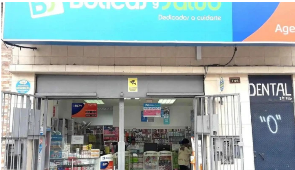
Boticas y salud callao 1 abierto ahora