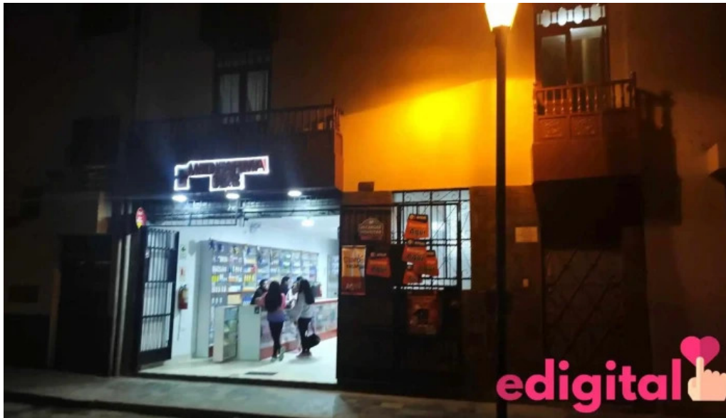
Medifarma cb direccion