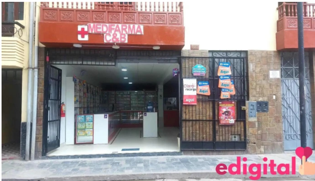
Medifarma cb del propietario