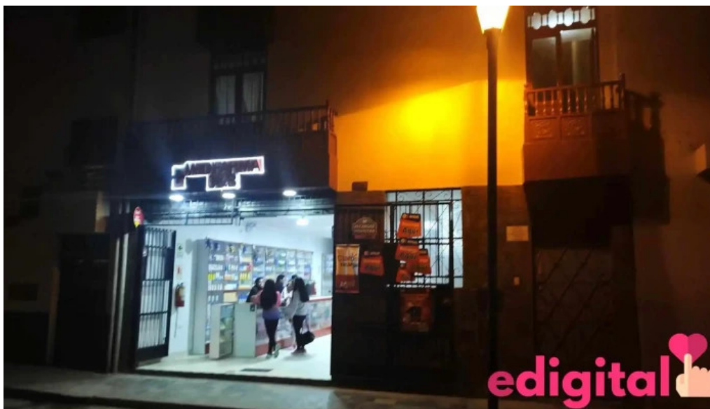
Medifarma c b cajamarca