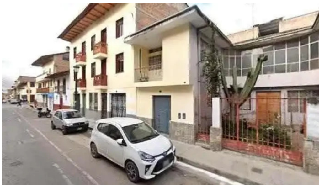
Medifarma cb direcciondeg