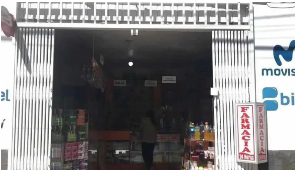
Farmacias vida instagram