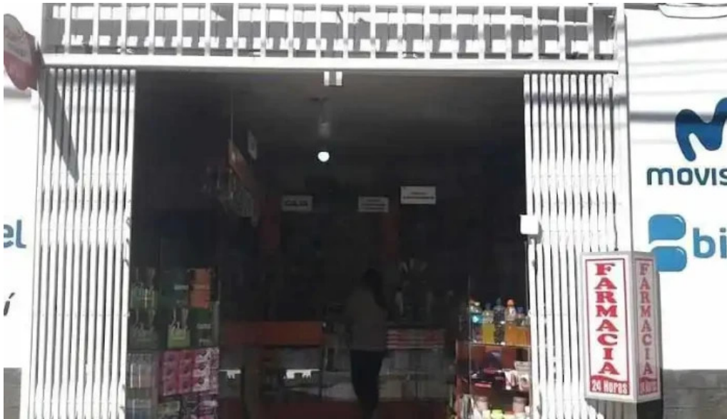
Farmacias vida cajamarca