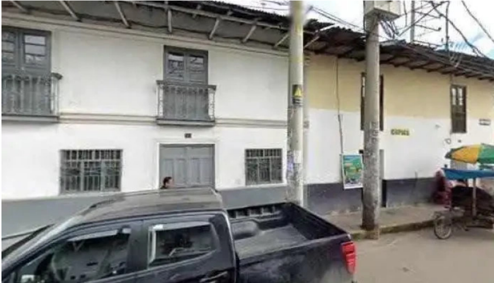
Farmacia nuestra senora de guadalupe comentarios