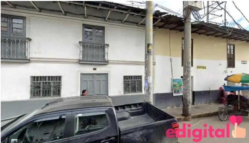
Farmacia nuestra senora de guadalupe cajamarca