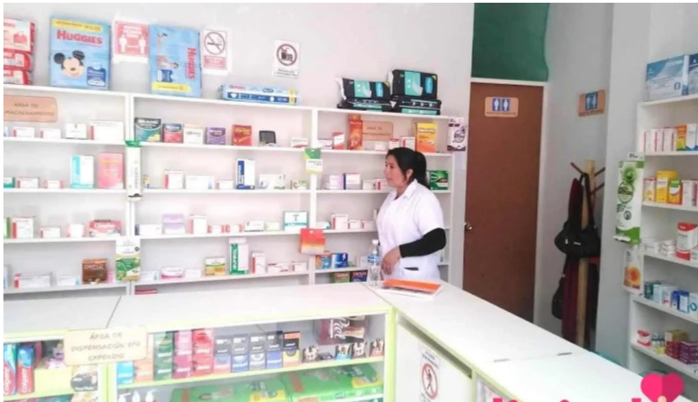
Botica yanethfarma cajamarca