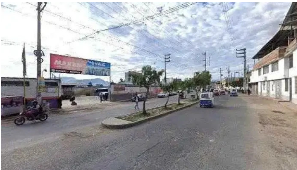
Botica yanethfarma telefonodeg