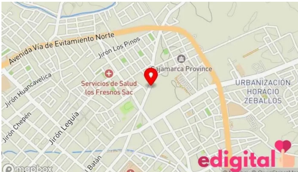
Botica vicfarma mapa