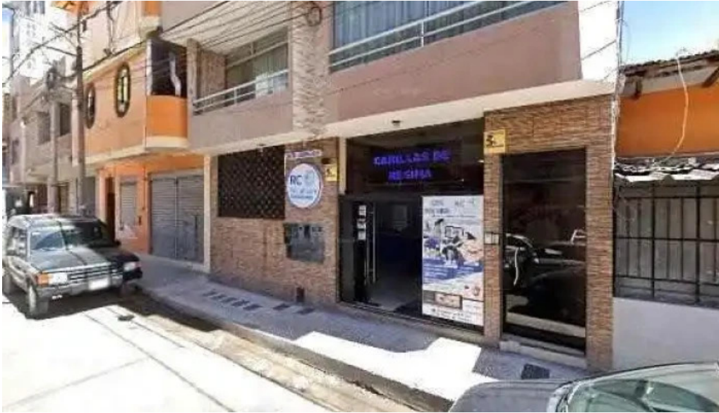
Botica vicfarma telefono