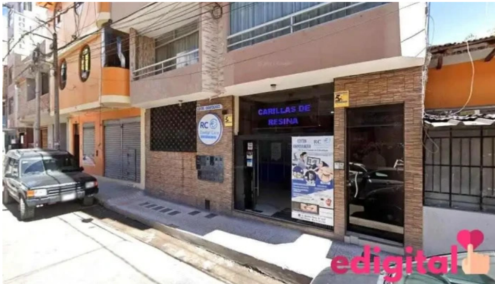
Botica vicfarma cajamarca