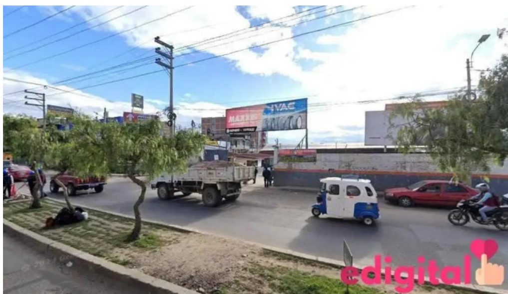
Botica san martin de porres cajamarca