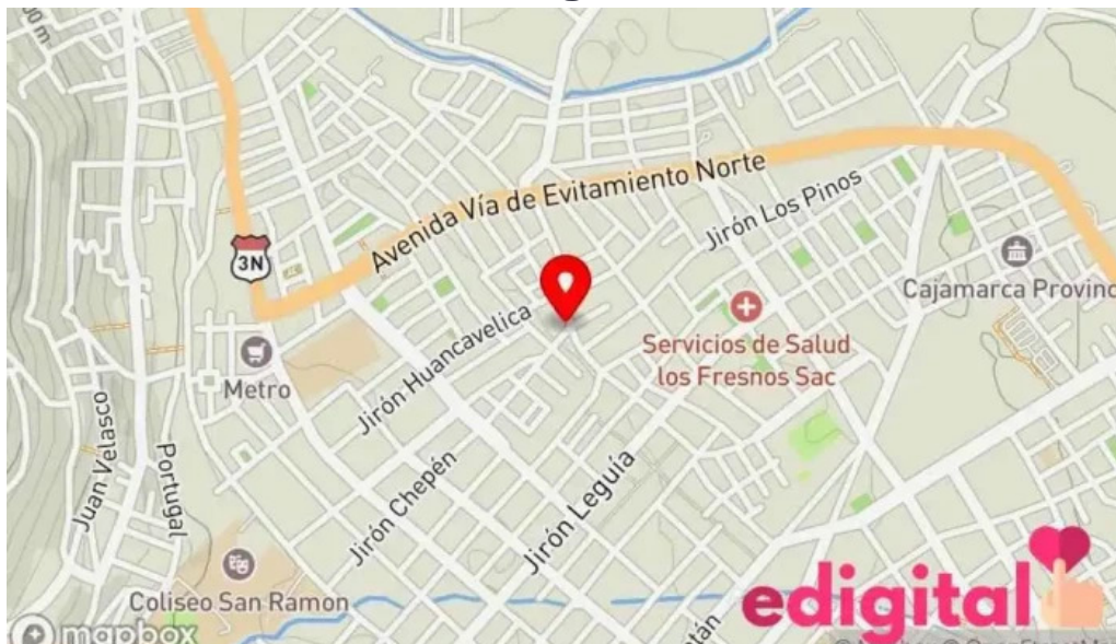
Botica nino jesus mapa