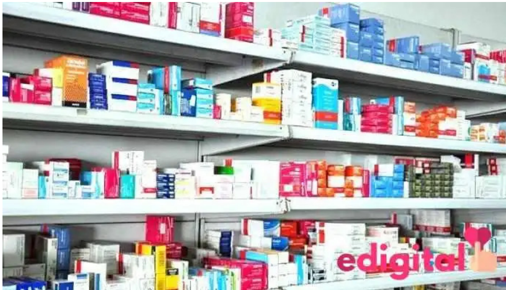
Botica nino jesus del propietario