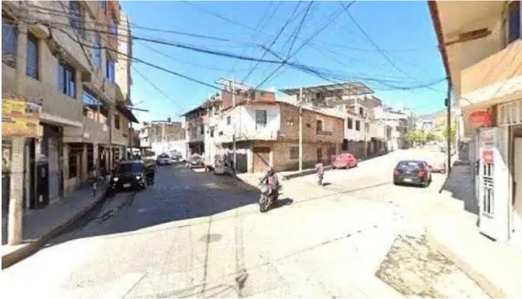
Botica nino jesus instagramdeg