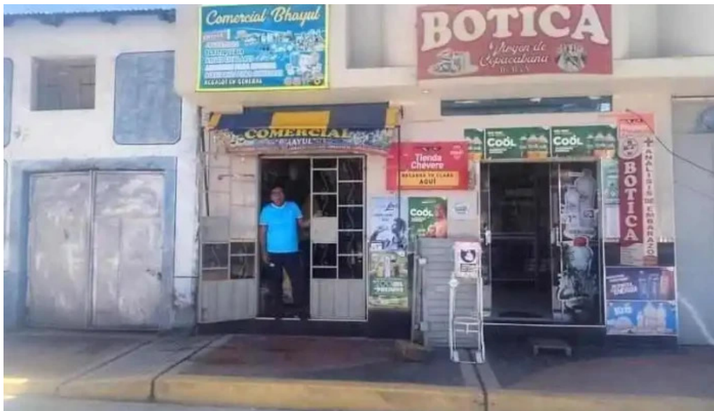
Botica virgen de copacabana cabana