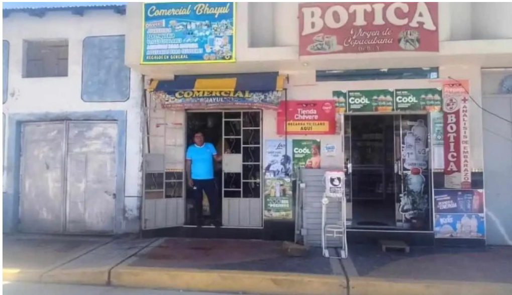
Botica virgen de copacabana instagram