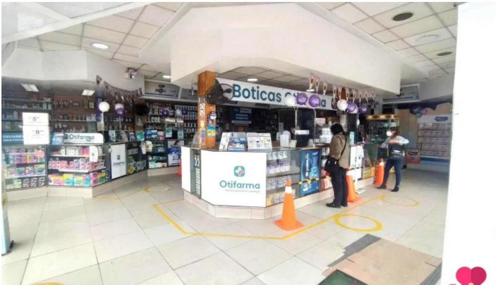
Boticas otifarma ugarte del propietario