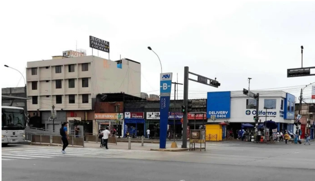
Boticas otifarma ugarte brena