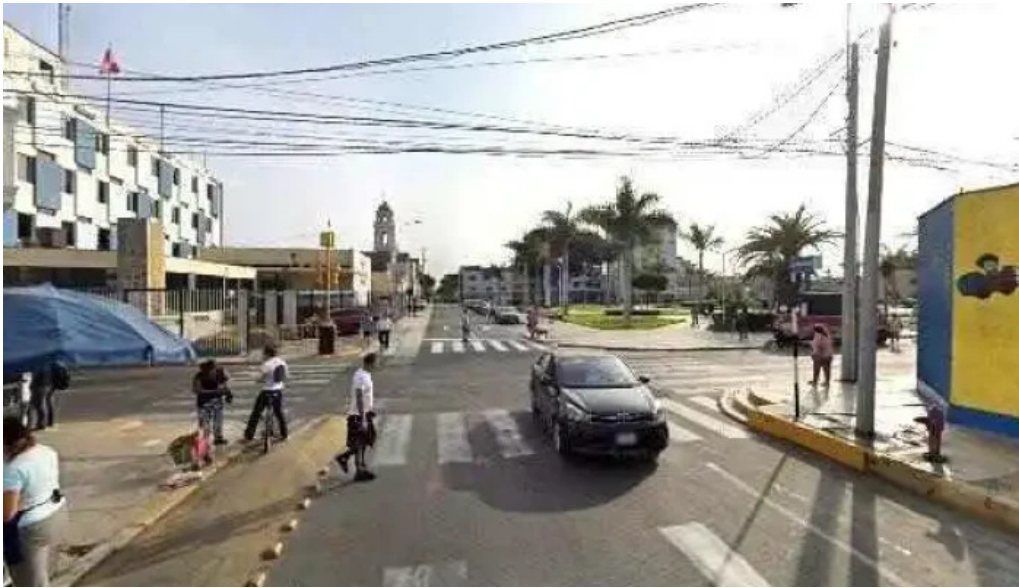
Farmacia alcazar abierto ahora